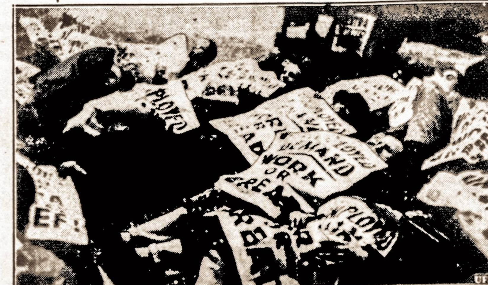
Protestuoja ant sniego. — Londono bedarbiai reikalaujami „darbo ar duonos“ sugulė Londono Oxford Circus aikštėje ir užsiklojo plakatais. Tos keistos protesto demonstracijos metu Londone smarkiai snigo.

NUMATOMA: Apsiniaukės. Gali būti sniego. Laipsniškai kylanti temperatūra. Saulė teka 7:20, leidžiasi 4:42. Dienos ilgis 9 val. 10 min.