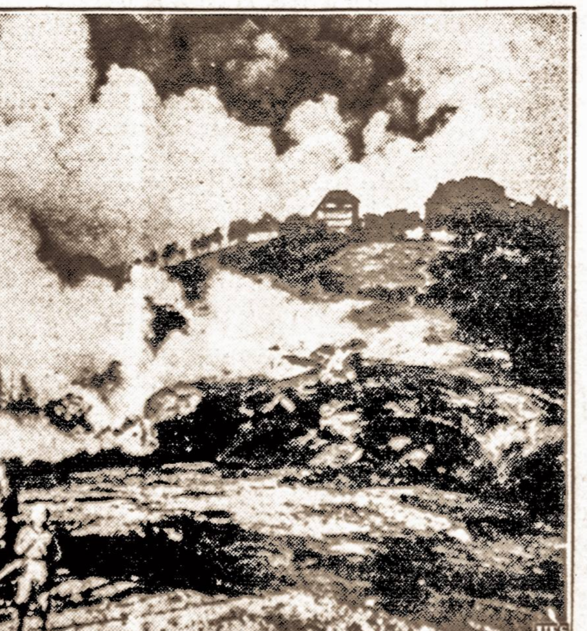
Kinijos kovos fronte. — Kinų japonų frontas pietinėje Kinijoje į vakarus nuo Cantono. Japonai puola kalną, ant kurio buvo įsitvirtinę kinai. Kalną vėliau japonai paėmė.

SAN JOSE, Costa Rica. — Costa Rico davė įsakymą 14 Italijos žydų seimui, neatidėliojant išvykti iš Costa Rico respublikos. Minėtos žydų šeimos atvyko ir apsigyveno Costa Ricioje neatlikę reikalingus formalumus. Minėti žydai sako, kad jie jau šešis mėnesius keliauja įvairiais laivais ieškodami vietos apsigyventi.