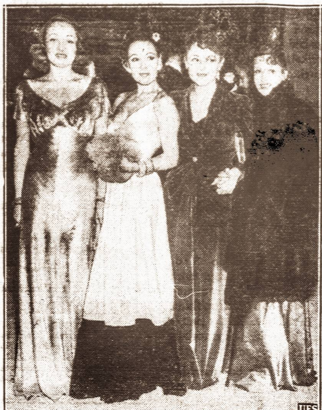
Keturios žvaigždės. — Keturios iš Hollywoodo žvaigždžių, kurios švenčių metu buvusiose puotose demonstravo savo naujausius rūbus.