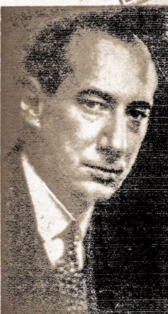
Pulk. Josef Beck Lenkijos Užsienių Reikalų Ministras

Vokietijoje pradėta kampa-nija uždrausti rūkymą ir alkoholinių gėrimų vartojimą jaunuoliams nuo 10 iki 18 metų ir mergaitėms nuo 10 iki 21 metų amžiaus.