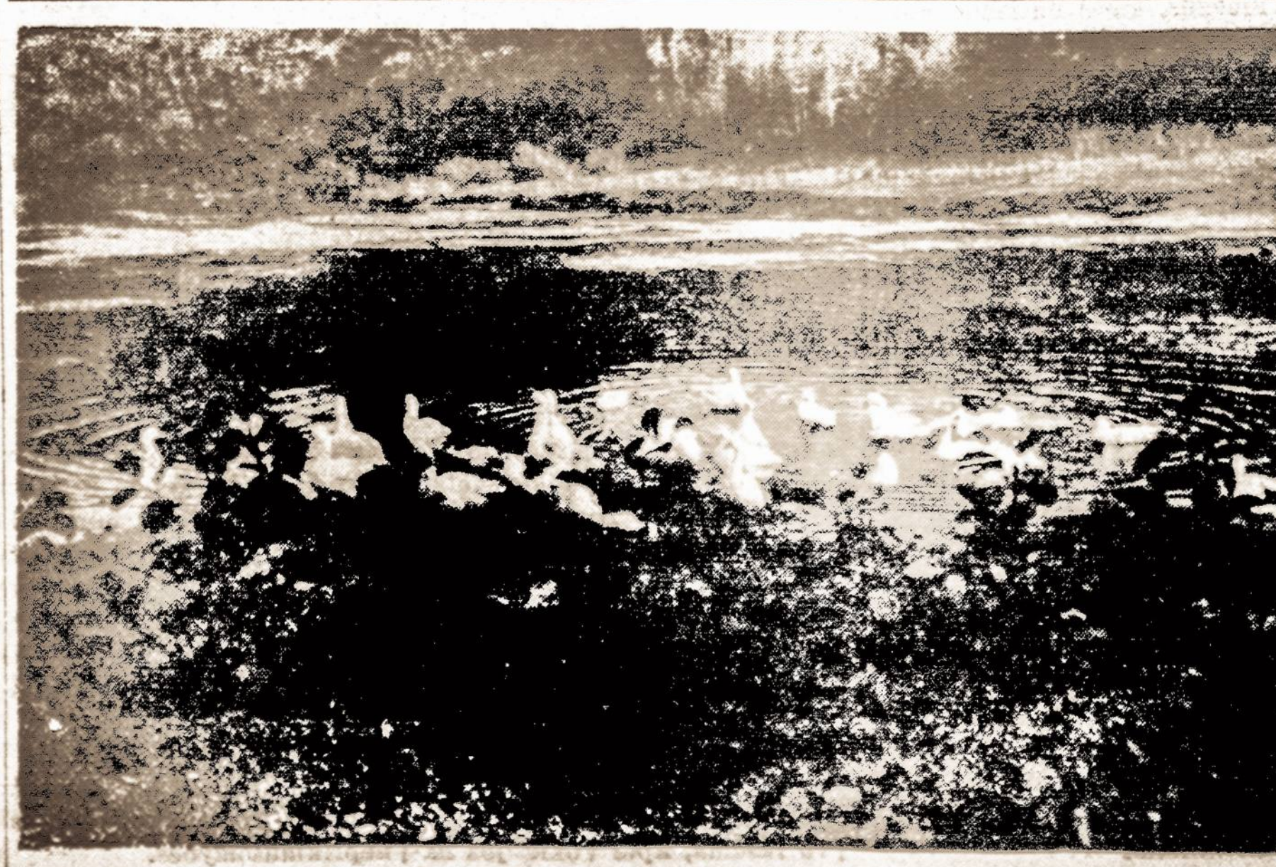
Graži Lietuvos žašelių "vasarvietė".

Klaipėdos kraštui susijungus su Lietuva klaipediečių lietuvių valdininkų kaip ir nebuvo. Kurie buvo rasti, tie visi buvo paaukštinti keliom kategorijom ir toliau proteguojami ir keliami. Buvo rūpintasi ir prieaugliu, buvo duodamos stipendijos ir skatinamas mokslas. Bet 1-moj eilėj rūpėjo kad lietuviai patektų į autonominės įstaigas, kurios buvo vokiškos ir tokiomis liko iki šiai dienai. Čia per daug kompliktuotas klausimas, kuris reikalauja specialaus nušvietimo.