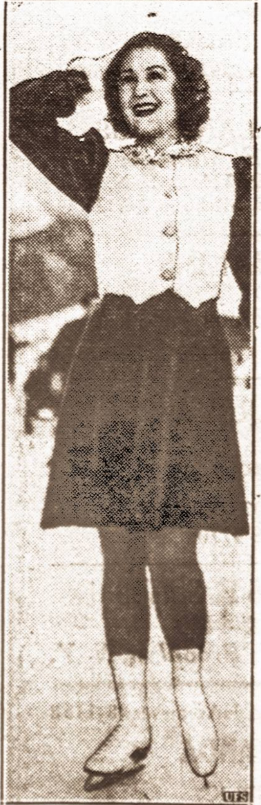
Ant pačiūzų. — Gražuolė Norma Shearer, vadinama pirmoji filmų ponija, kuri matoma su naujausiu čiuožimo kostiumu savo atostogų metu, Sun Valley, Idaho valstyboje.