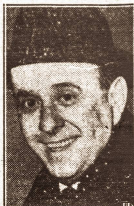
Masaryko sūnus. — Pirmojo Čekoslovakijos respublikos Prezidento Masaryko sūnus Jan, kuris neseniai atvyko į Jungtines Amerikos Valstybes. Čia jis gyvens kurį laiką.

KAUNAS. — Lietuvos eksportui padidinti ir jam paskatinti yra iškilęs reikalas įsteigti eksporto fondą. Dabartinio metu Pr., pram. ir amatų rūmai tiria, kaip šis fondas turėtų būti sudarytas ir kaip jis eksportą turėtų paremti. Eksporto fondui įsteigti bus išleistas atskiras įstatymas.