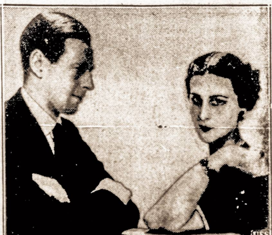
Australijos Gubernatoriaus, — Anglijos karaliaus Jurgto VI brolio Duke of Kent, su savo žmona. Jiedu šių metų pavasarį išvyksta į Australiją, kur jis eis Generalinio Gubernatoriaus pareigas.