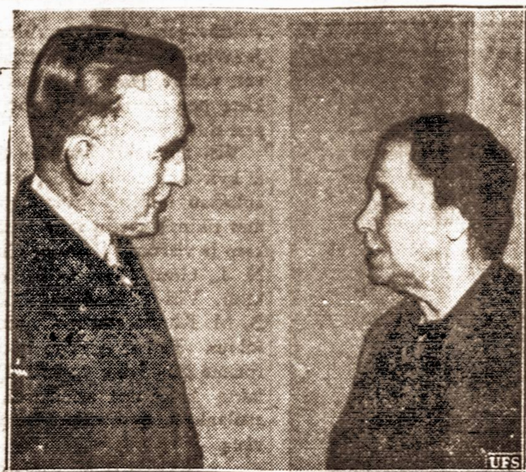
Vienintelė moteris J.A.V. Senate. — Hattie W. Caraway, vienintelė moteris senatorė, kuri yra J.A.V. Senate. Ji čia kalba su senatorium O'Mahoney iš Wyoming valstybės.