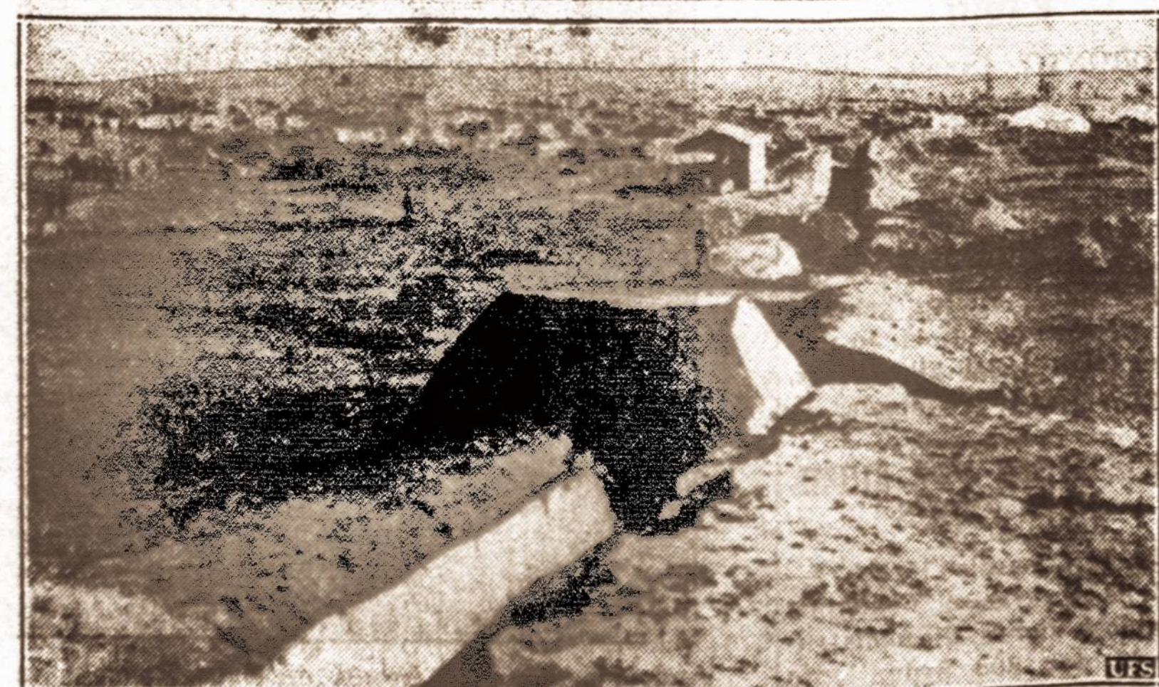
Apkasai Libijos pasienyje. — Italijos Prancūzijos santykiams įsitempus, visu Libijos pasieniu Afrikoje italai pastatė kariuomenės stovyklų ir iškasė apkasus.

Labiausiai karą ir jo nedaugtelę maistą: duona, lėšius, šabalonus, menkes. Nei mėsos, nei makaronų, nei cukraus negausi. Ir nekarta atsitinka, kad ilgas valandas išstovėję prie krautuvių, žmonės grįžta namo tušiom rankom: į centrinius šandien nepakankamai pristatytą maisto. Laimingi tie, kurių sūnūs ar L. O.