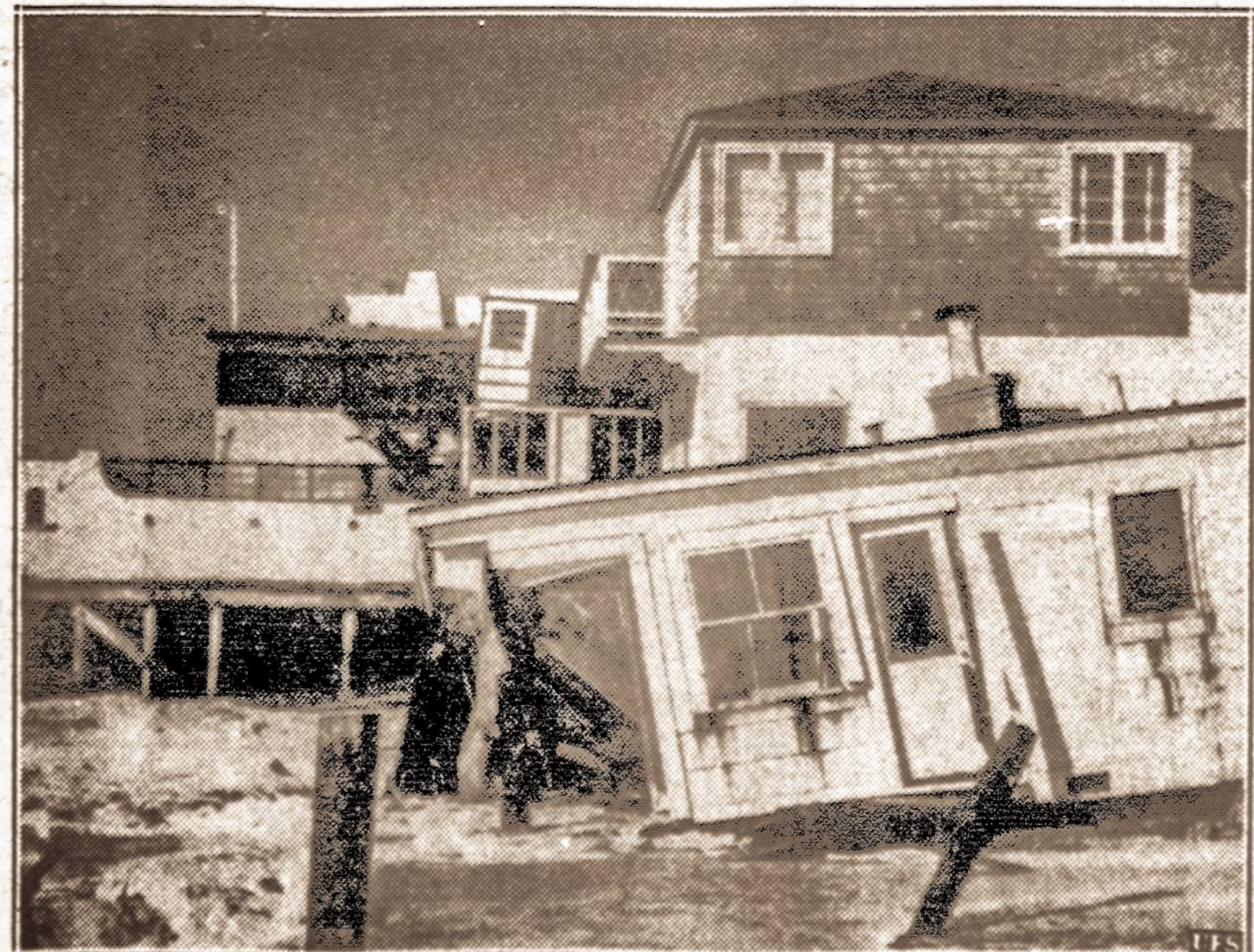
Audrai praėjus. — Šiomis dienomis Ramiojo vandenyno pakraščiuose siautė didelės audros. Audros metu daug namų išvartyta ir sugriauta Santa Barbara ir San Diego apylinkėse.

NUMATOMA: Giedra ir šaltiau. Saulė teka 7:20, leidžiasi 4:49. Dienos ilgis 9 val. 27 min.