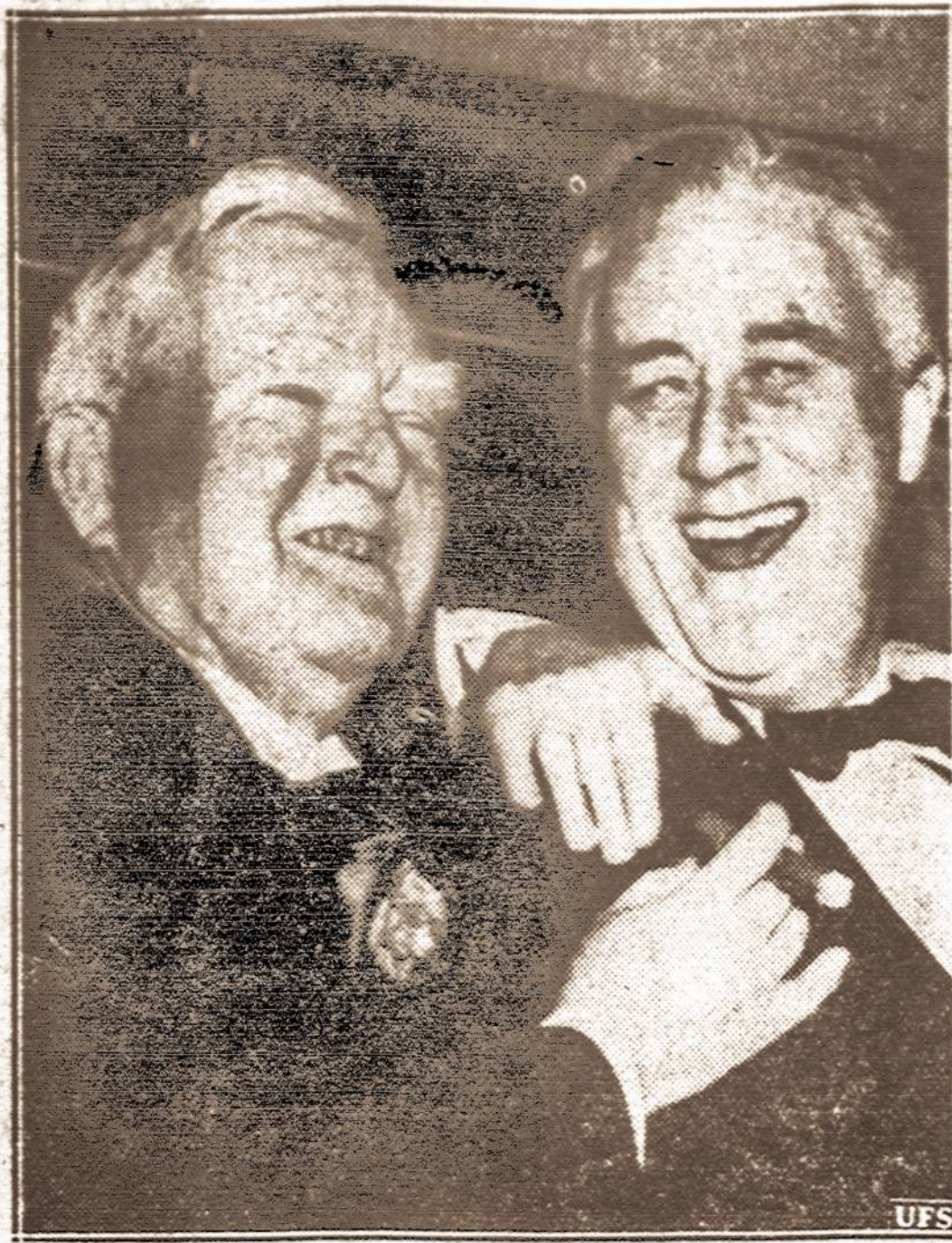
Prieteliai. — Nors Vice Prezidentas Garner nevisuomet sutinka su Prezidento Roosevelto politika ir reformomis, bet paprastai gyvenime jie visuomet buvo ir yra dideli bičiuliai.

BERLIN, sausio 11 d. — Berlyne ir kituose Vokietijos miestuose šiomis dienomis su- laikyta dar 300 žydų, kurie pasižadėjo iki šiol išvažiuoti iš Vokietijos, bet neišvažiavo.