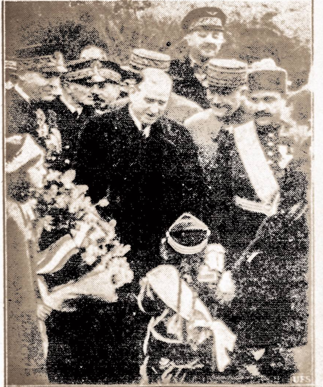
Grįžo iš Tuniso. — Prancūzijos Ministras Pirmininkas Daladier neseniai grįžo iš Tuniso į Prancūziją. Čia matyti, kaip Tunise jį iškilmingai sutiko vietos valdžios atstovai ir visuomenė.

Iš Čekoslovakijos šiomis dienomis į Palestiną bus išsiųsta 2,500 žydų, kurie anksčiau gyveno Sudetų krašte, kuris dabar yra Vokietijos teritorijos dalis.