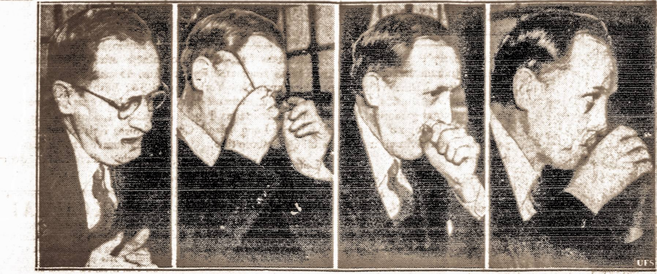
Klydo, kad kalbėjo apie politiką. — J.A.V. Prekybos Sekretorius Harry Hopkins Senato Komisijos posėdyje pareiškė, kad jis būdamas WPA viršininku padarė klaidą kalbėdamas apie politiką. Kalbėdamas Hopkins gerklė taip išdžiūvo, kad labai dažnai gėrė vandens.

Vokiečių laikraštis "Konegsb. Allg Ztg." praneša, kad netoliese Altenburgo miške buvo rastas grybas kurio skersmuo buvo vieno metro. Tačiau tas grybas turėjo ir nemažą svorį. Jis svėrė 50 svarų. Aiškūs dalykas, kad jį ir parnešė negalima buvo vienam vyrui. Todėl jis buvo pargabentas keliese ir specialiai išstatytas pažūrėti. Toliau jis nepaprasto grybo likimas nepraneštas.