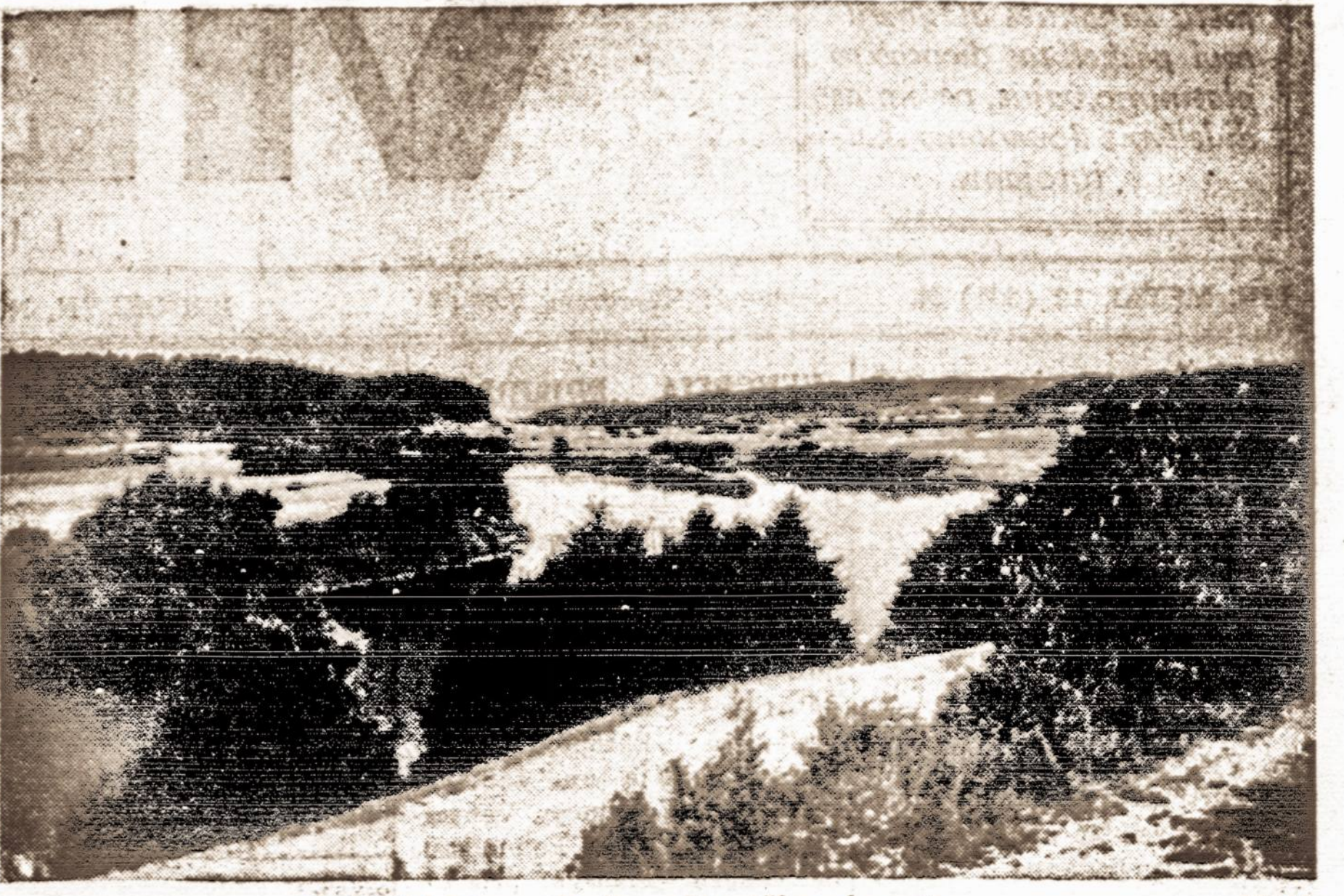
Gražioji Lietuva. Žavingos Ne vėžio pakrantės.