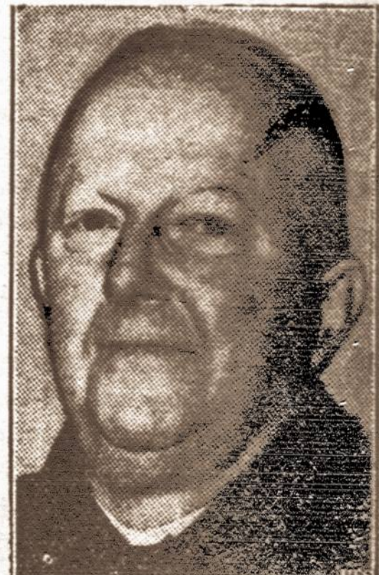
Praneš apie Kiniją. — Jungtinių Amerikos Valstybių pasiuntinys Kinijoje Nelson T. Johnson, atvyko į Washingtoną pranešti prezidentui apie dabartinę padėtį Kinijoje.

Goeringui bus pavesta Vokietijos teatrai, radijo ir kino teatrai, kuriuos iki šiol prižiūrėjo ir kontroliavo Goebbels.