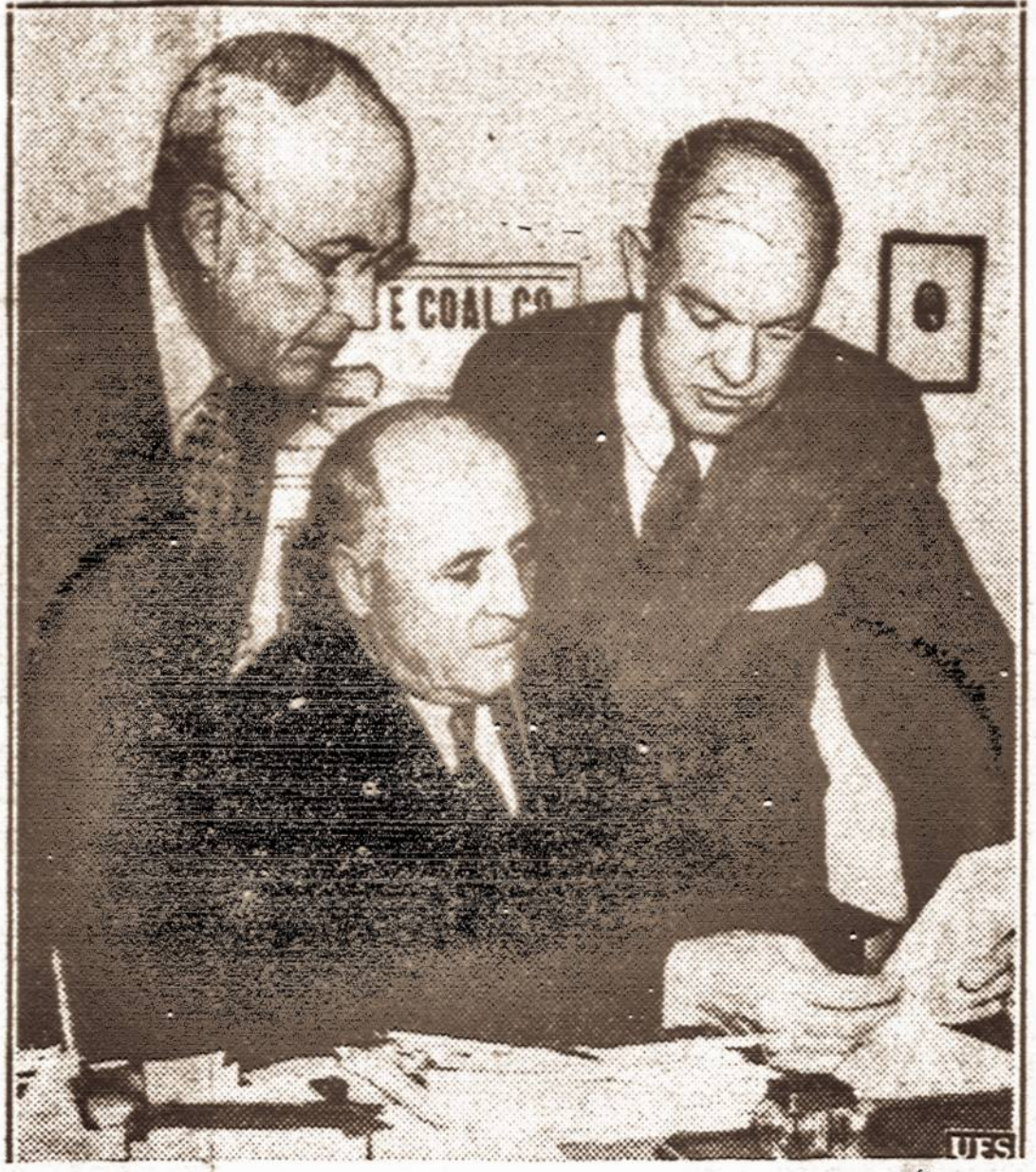
Krašto apsaugos programa. — Kairėje J.A.V. kariuomenės štabo viršininkas Generolas Malin Craig ir dešinėje Karo Sekretorius Harry H. Woodring kartu su Atstovų Rūmų nariu Andrew J. May svarsto naują krašto apsaugos programą, kuri dabar įteikta kongresui. Atstovas May kongresui įteikė įstatymo projektą.