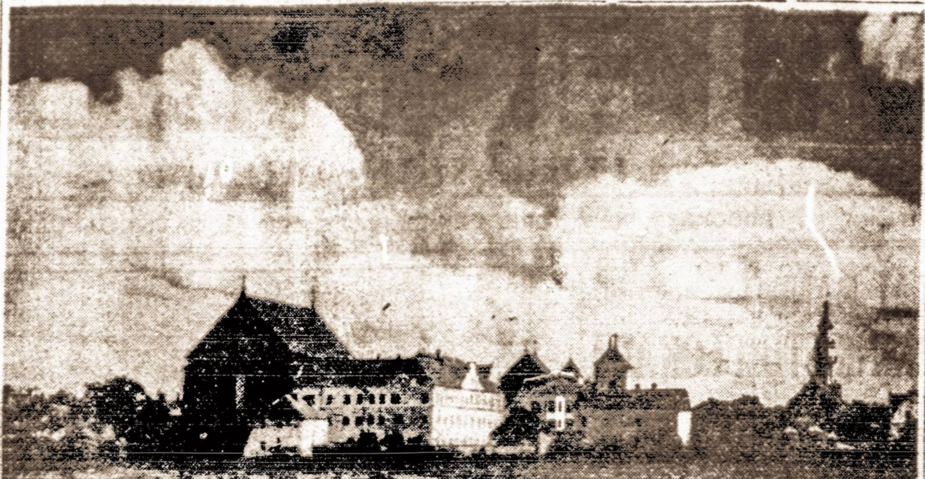
Senasis Kaunas, Nemuno ir Neries santakoje. Čia kai kurie pastatai statyti dar Vytauto D. džio laikais.