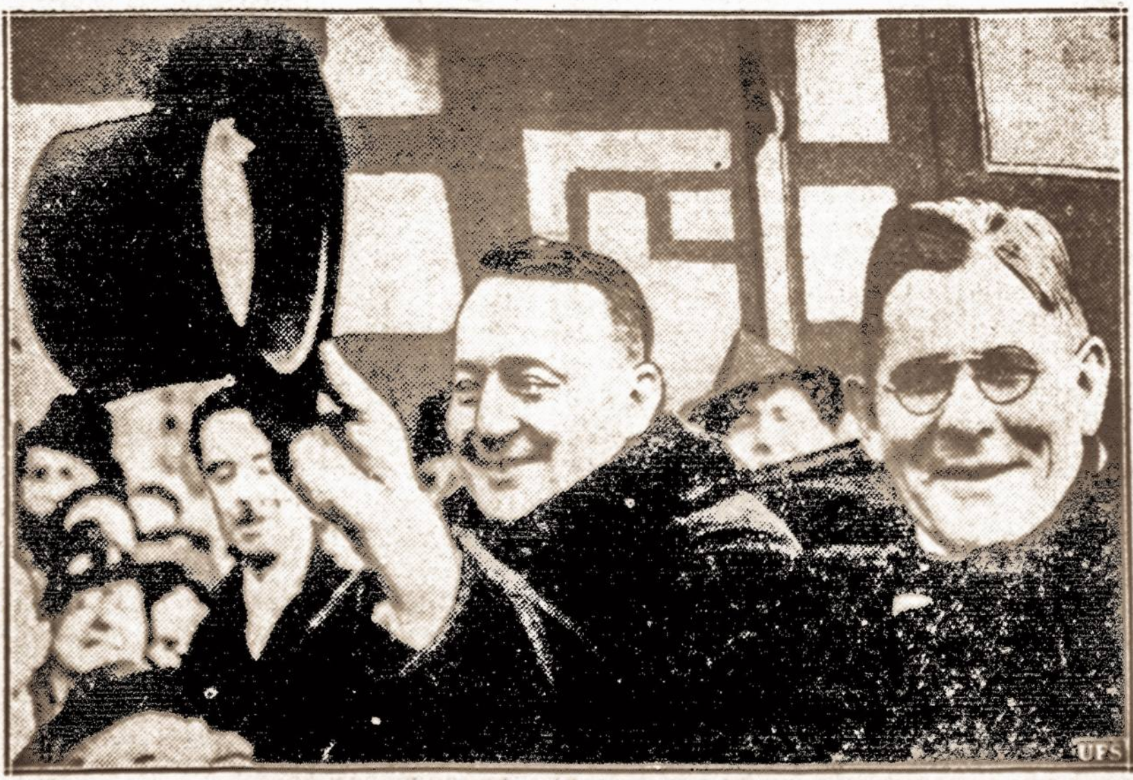
Naujas Pensilvanijos gubernatorius. — Dešinėje, naujasis Pensilvanijos valstybės Gubernatorius Arthur H. James, republikonas, kuris šiomis dienomis buvo įvesdintas į naująsias pareigas Harrisburgo mieste. Šalje jo, senasis gubernatorius George H. Earl, demokratas.