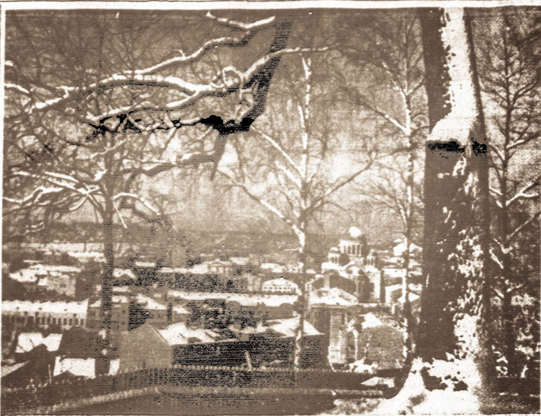
Kauno miesto vaizdas žiemą, žiūrint nuo Vytauto kalno.

Vokiečių rinkikų skaičiaus padidėjimą laikraštis aiškina didesne agitacija, kurią vokie-