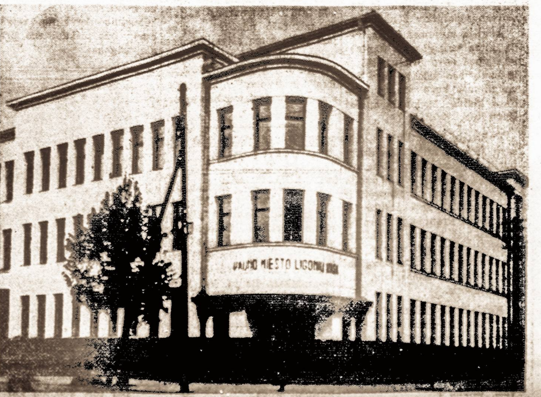
Kauno Miesto Ligoninių Kasos naujieji rūmai.

Tačiau atsirado kliūtis, toje vietoje, kur mažiausia buvo laukiama. Ripeliui atsakė leis-ti žygiuoti Palestinos valdžia.