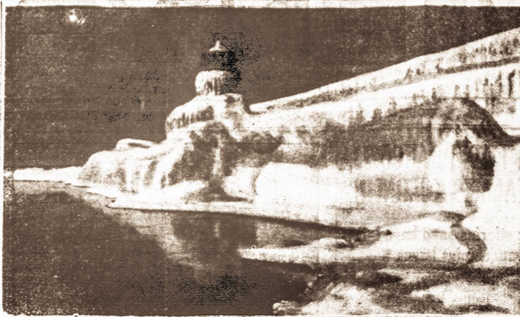
Nors Klaipėdos uostas žiemą neužšala, bet pakrantes apgaubia ledų sluoksniai. Čia matome ledo sukautytą Klaipėdos uosto švyturį.