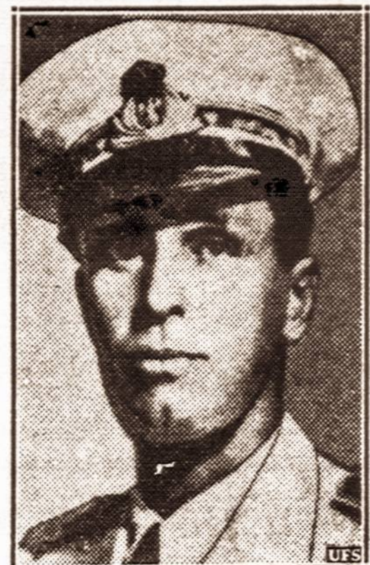
Ispanijos karalius. — Už teikiama Ispanijos frankistams pagarbą Mussolini nori Ispanijai duoti karalių, Italijos fašistų partijos nari, karališkos kilmės Aosta kunigaikštį.

Italija nuo pereinamųjų metų stiprina savo karo laivyną, turi 125 povandeninius laivus