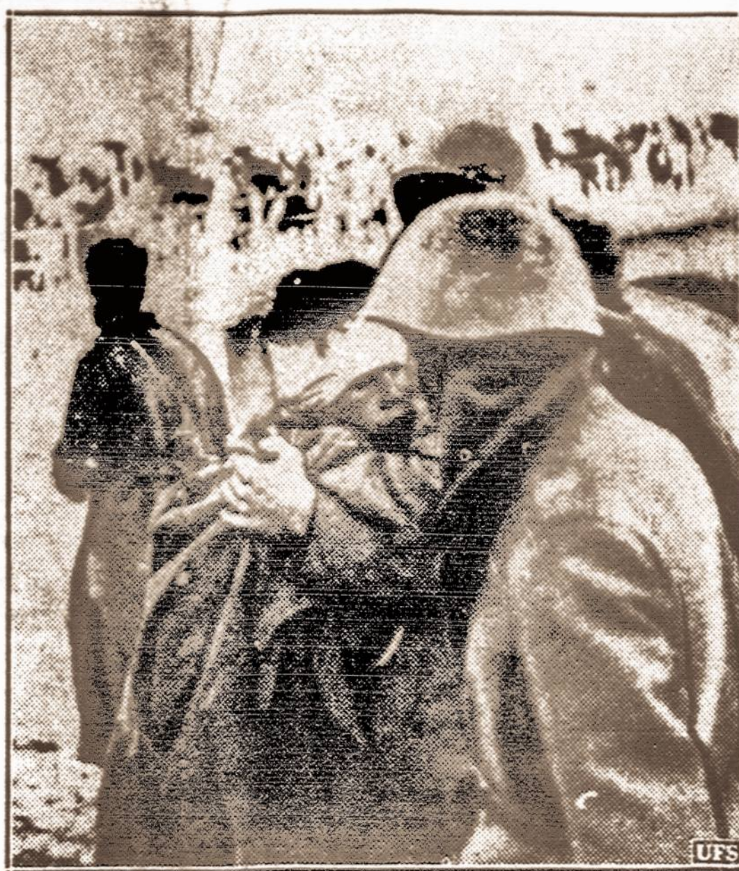
Barcelonos fronte. — Ispanijos šiaurės fronte, kur dabar eina dideli mūšiai, frankistai jau artinasi prie Barcelonos. Paveiksle matyti frankistų stovykla, kur sužeisties karius suteikiama pirmoji pagalba.

Jos rankinukė rasta grąšančio turinio laišku.