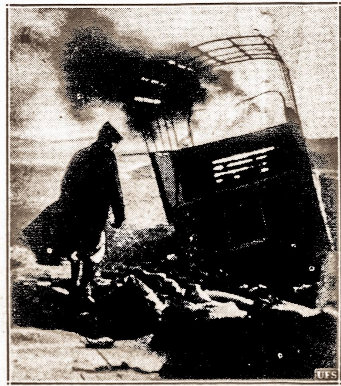
Bombardavo sunkvežimį. — Ispanijos frankistai Katalonijoje puldami Barceloną bombardavo ir vyriausybinių sunkvežimius gabenančius maisto ir amunicijos į frontą. Čia matyti vienas subombarduotas sunkvežimis.

KLAIPĖDA. — Pedagoginis institutas yra Klaipėdos krašto direktorijos namuose. Dabar direktorija pranešė institutui, kad jis nuo vasario 1 d. iš tų namų išsikeltų. Tuose pačiuose namuose yra ir vokiečių mokytojų seminarija, bet seminarijai direktorija nesiūlanči išsikelti.