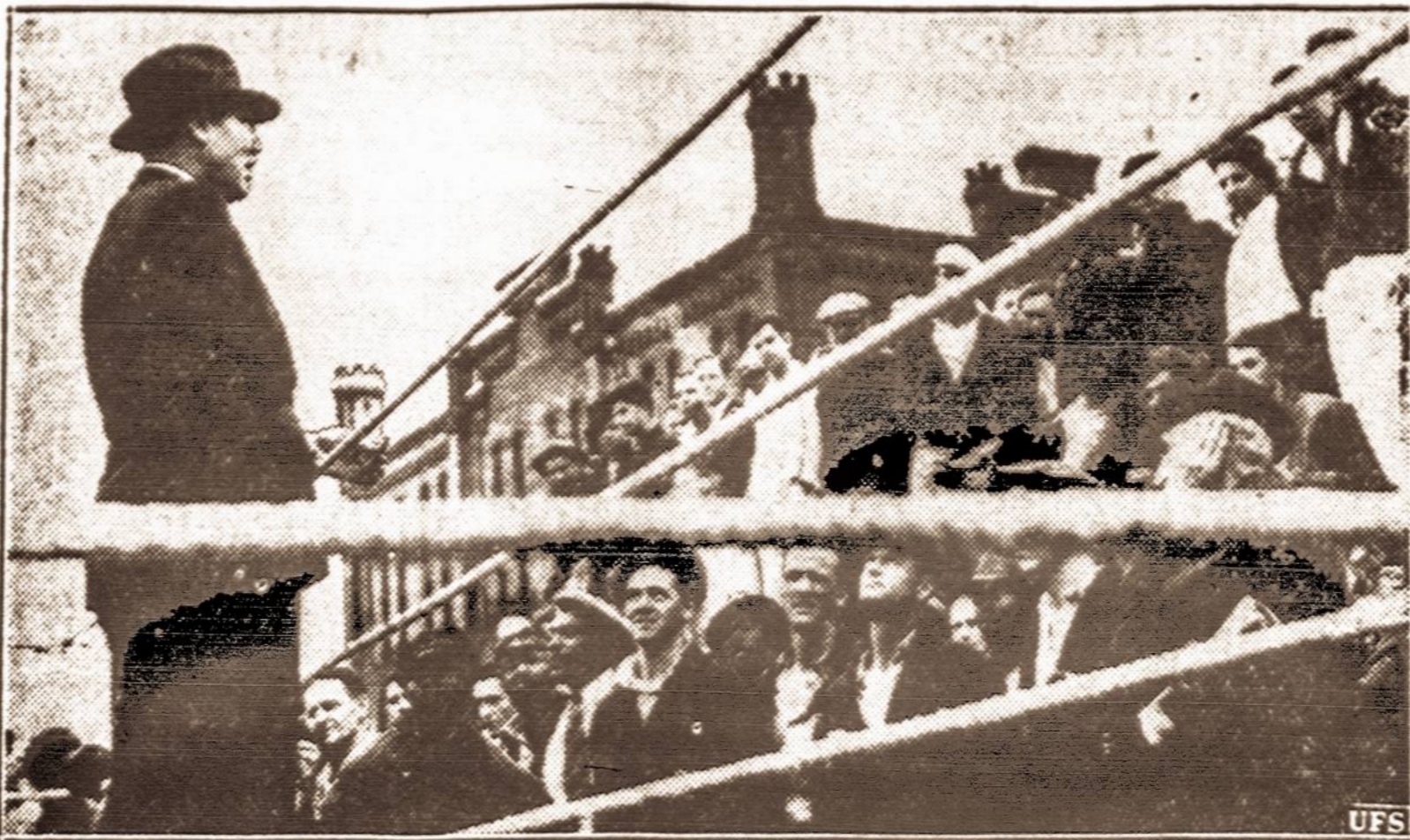
Dempsey kalba su kaliais. — Buvęs pasaulinis bokso čempionas Jack Dempsey, lankydamas pietines valstijas, aplankė Raleigh, N. C. kalėjimo kalinius, su kuriais pasikalbėjo. Kai kurie kaliniai jau buvo kalėjime, kai Dempsey buvo čempionu.