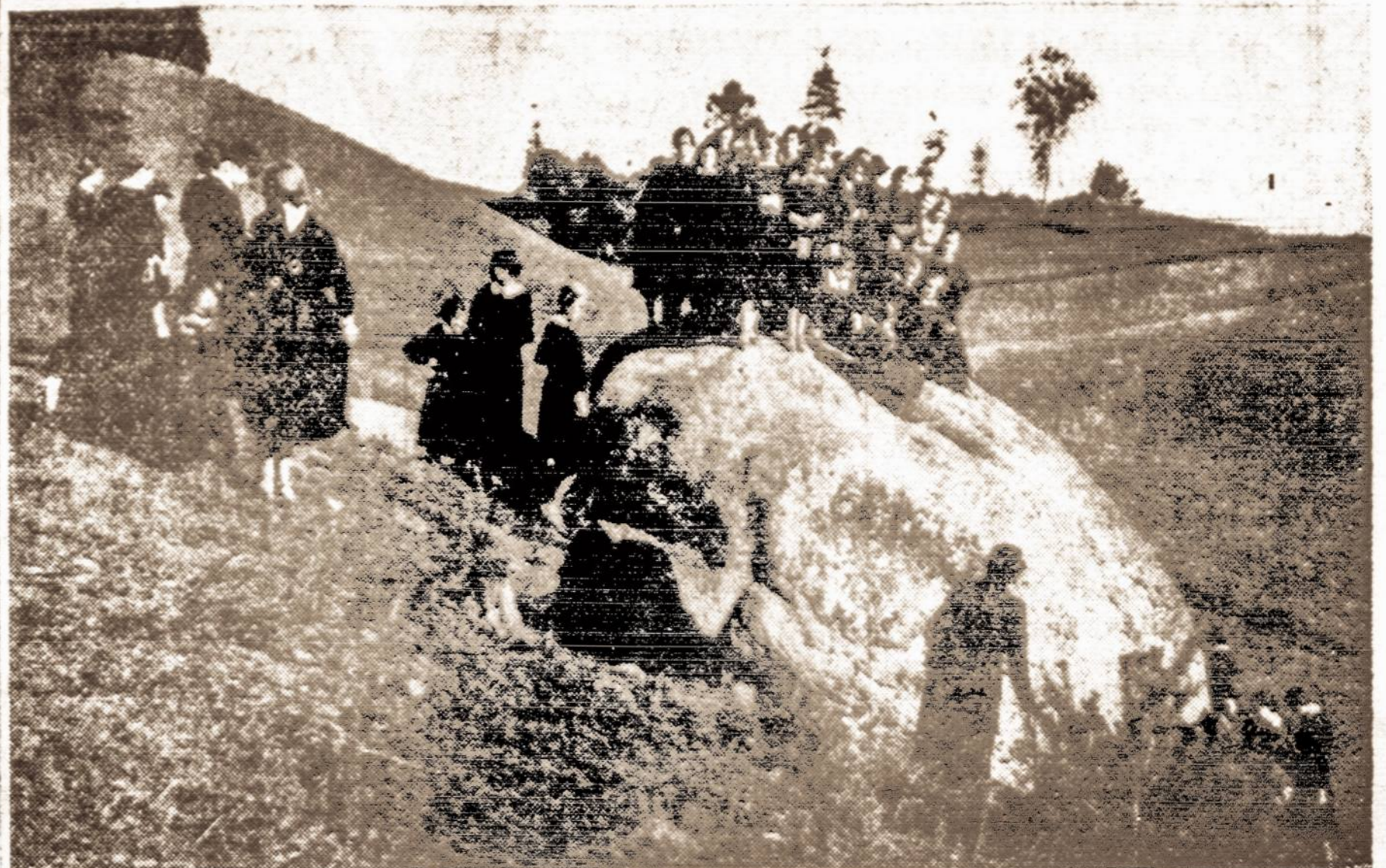
Didžiausias Lietuvos akmuo "Punktukas" ties Anykščiais; prie akmens matome mergaičių gimnazijos ekskursiją. VDV

Pastaraisiais laikais žymiai pakilo lašinių kiaulių eksportas iš Lietuvos į Vokietiją.