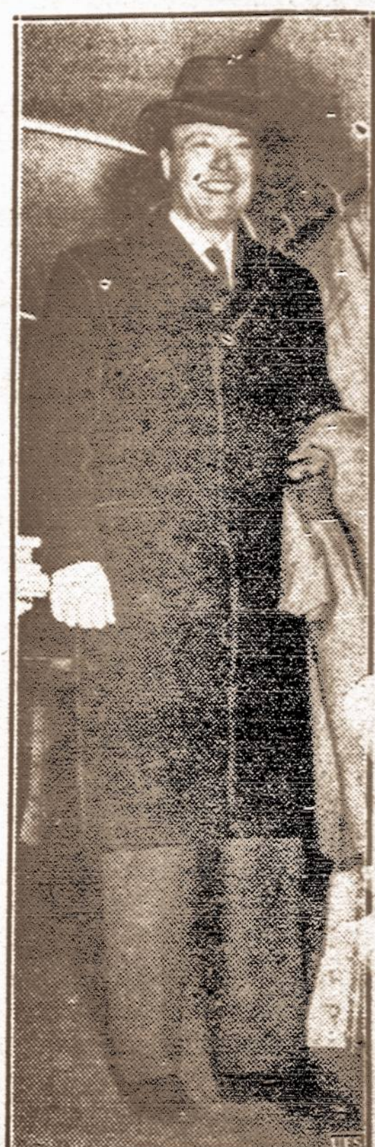
Išvyko. — Jungtinių Amerikos Valstybių pasiuntinys Paryžiuje William C. Bullitt, išvyko į Paryžių eiti savo pareigas.

Atsargumo dėlei Mussolini pašaukė į karo tarnybą 200,000 rezervų. Rezervų šaukimas padarytas ryšium su karu Ispanijoje.