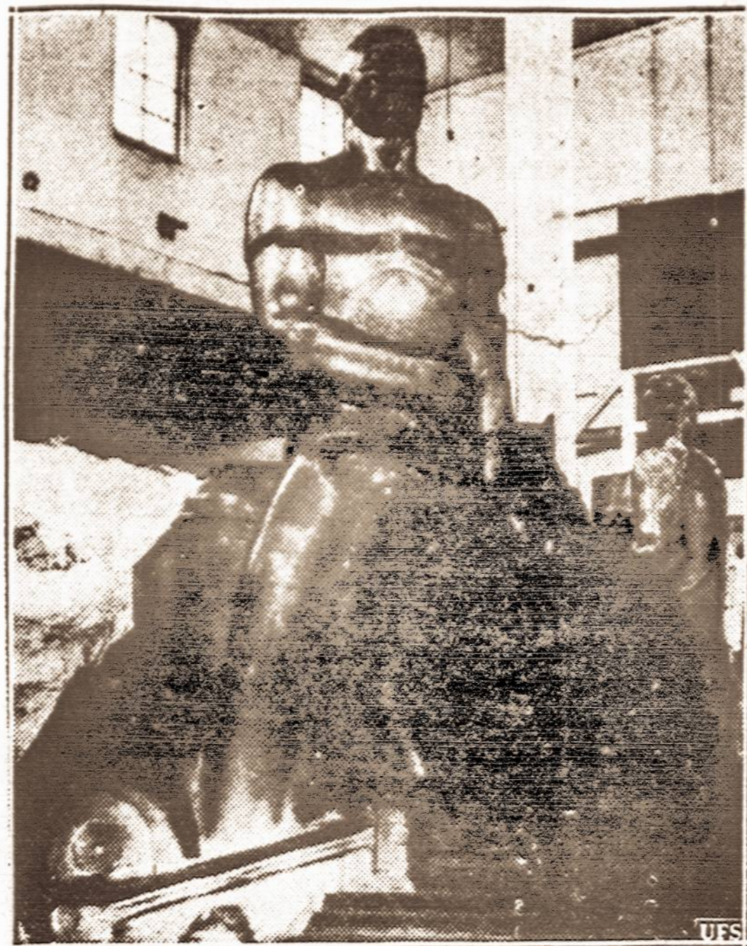
Milžininkė parodai. — Milžininkė statula, kuri Pasaulinėje Parodoje vaizduos darbą ir industriją. Tokių statulų viso bus 12.