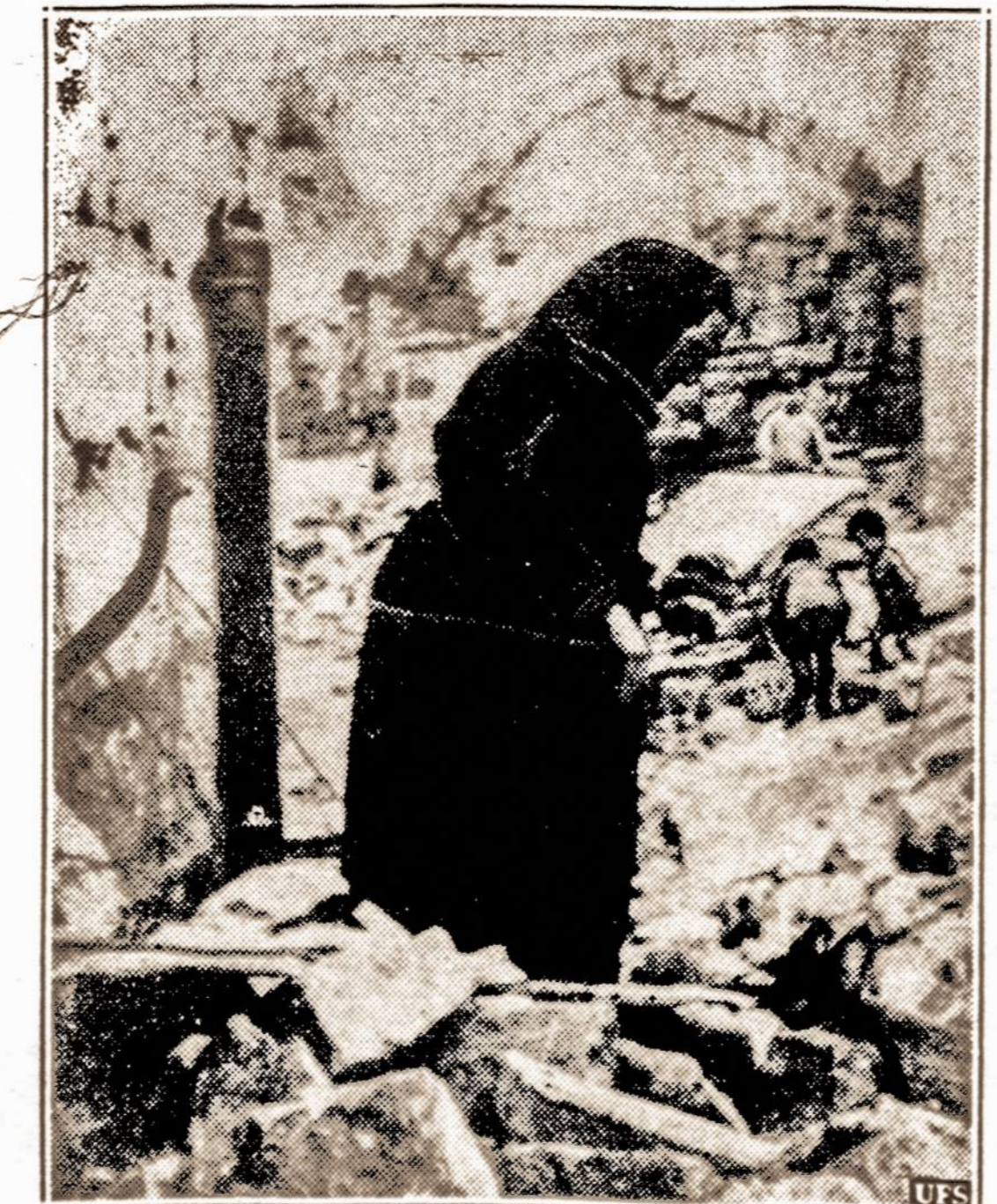
Tremtinė tarp griuvėsių. — Senutė karo tremtinė, grįžusi į Borjas Blancas miestą Ispanijoje, ieško savo daiktų likučių savo namo griuvėsiuose. Dabar tūkstančiai tremtinių grįžta į savo senas gyvenimo vietas, bet randa tik griuvėsius ir nuodegulus.