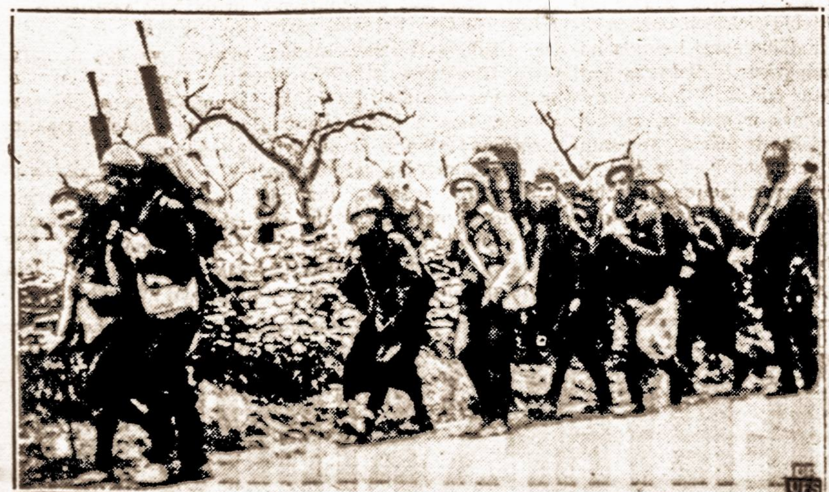
Frankistai žygiuoja į Kataloniją. — Frankistų kariuomenės dalys, kulkosvaidžiais nešinę, žygiuoja į Kataloniją, dabar tos dalys eina Prancūzijos pasienio linkui.

Prasidėjus didesniems šalčiams Kaune ir provincijoje padažnėjo susirgimai gripu. Šią žiemą gripu persergama lengva forma.