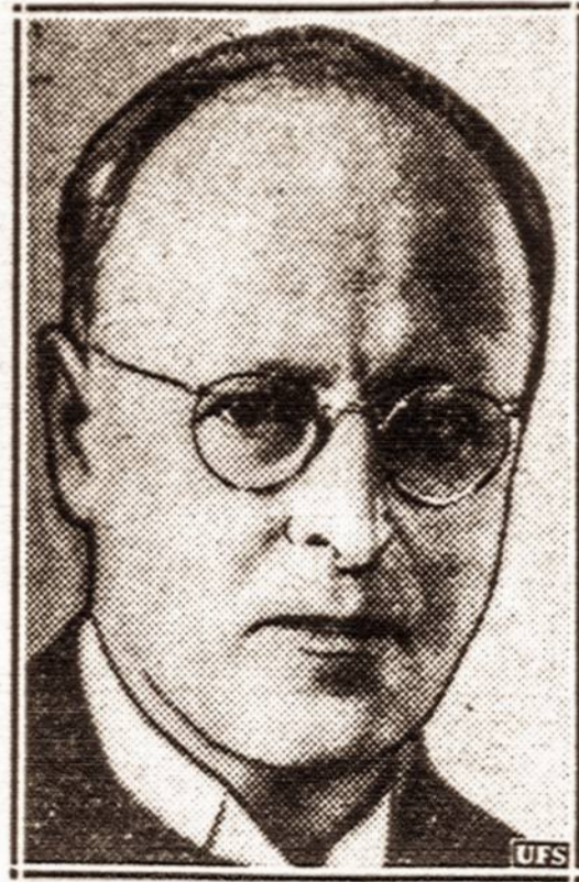
Kanados ministras. — Norman A. McLarty, Kanados Paštų Ministras. Jis yra liberalas ir vienas jauniausių W. L. Mackenzie King ministrų.

Frankistai bando apsupti 70,000 vyriausybinių šiaurės rytų bare