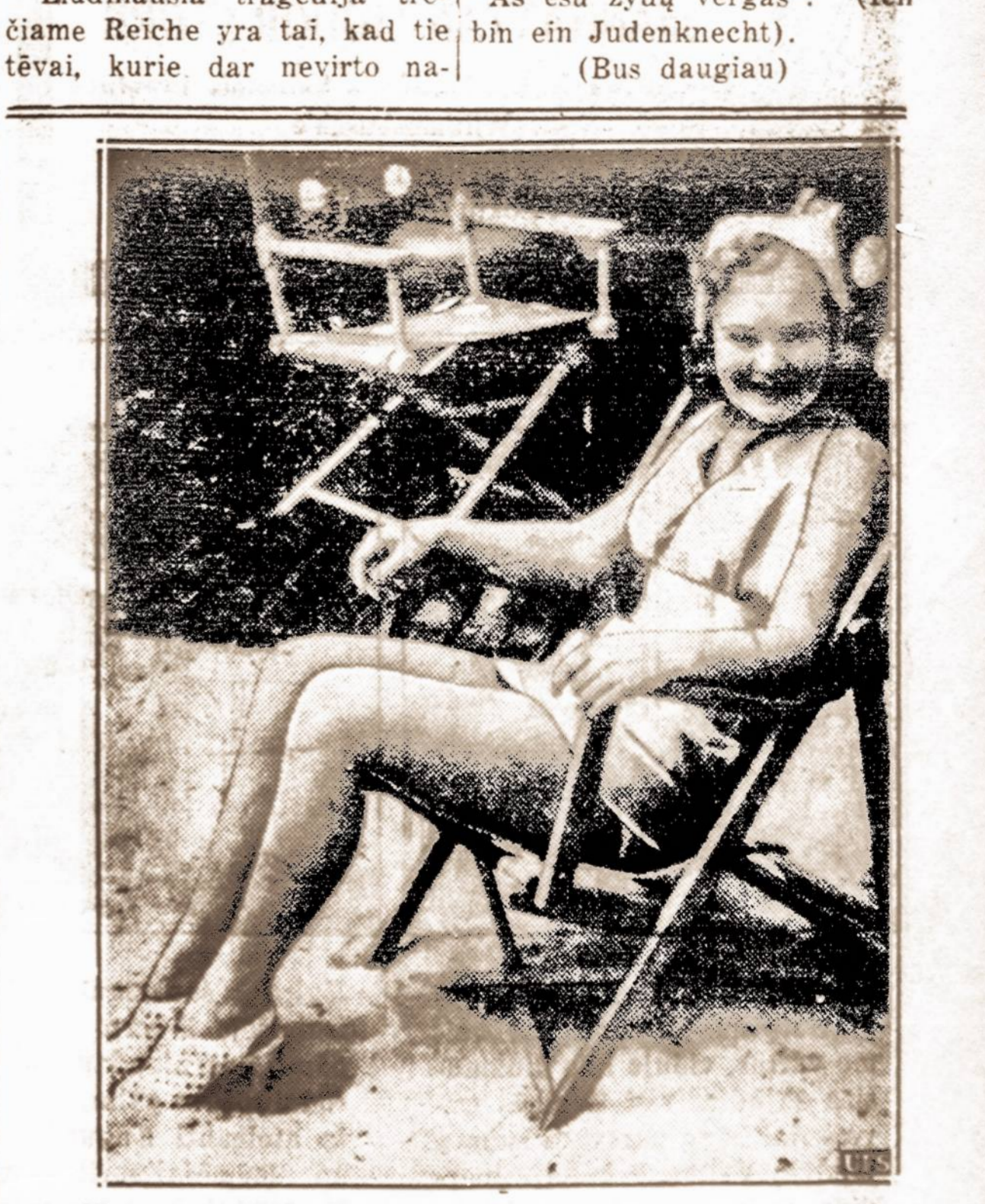
Kojos smėlyje. — Gražuolė Sonja Henie nevisuomet su pačiužomis raizo ledą. Kartais ir ji po selmingų pasirodymų žiemos sporto karnavaluose mėgsta atvažiavus Floridon kojomis paraižyti karštą smėlį vietoje ledo.

Liūdniausia tragedija trečiame Reiche yra tai, kad tie tėvai, kurie dar nevirto na-