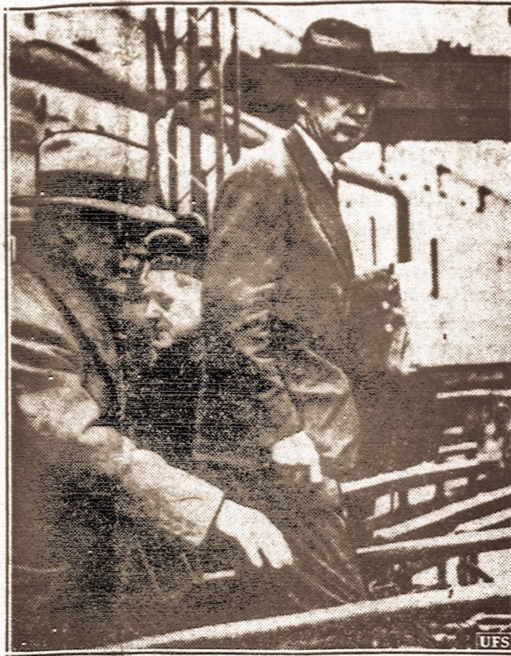
Pulkininkas nešioja kepurę. — Pulkininkas Lindbergh nepaprastojė padėtyje jis nešioja kepurę. Be to dar viena naujiena. Vietoj skristi iš Anglijos į Prancūziją jis laivu važiavo. Šis Amerikos aviatorius Europoje studijuoja aviaciją.