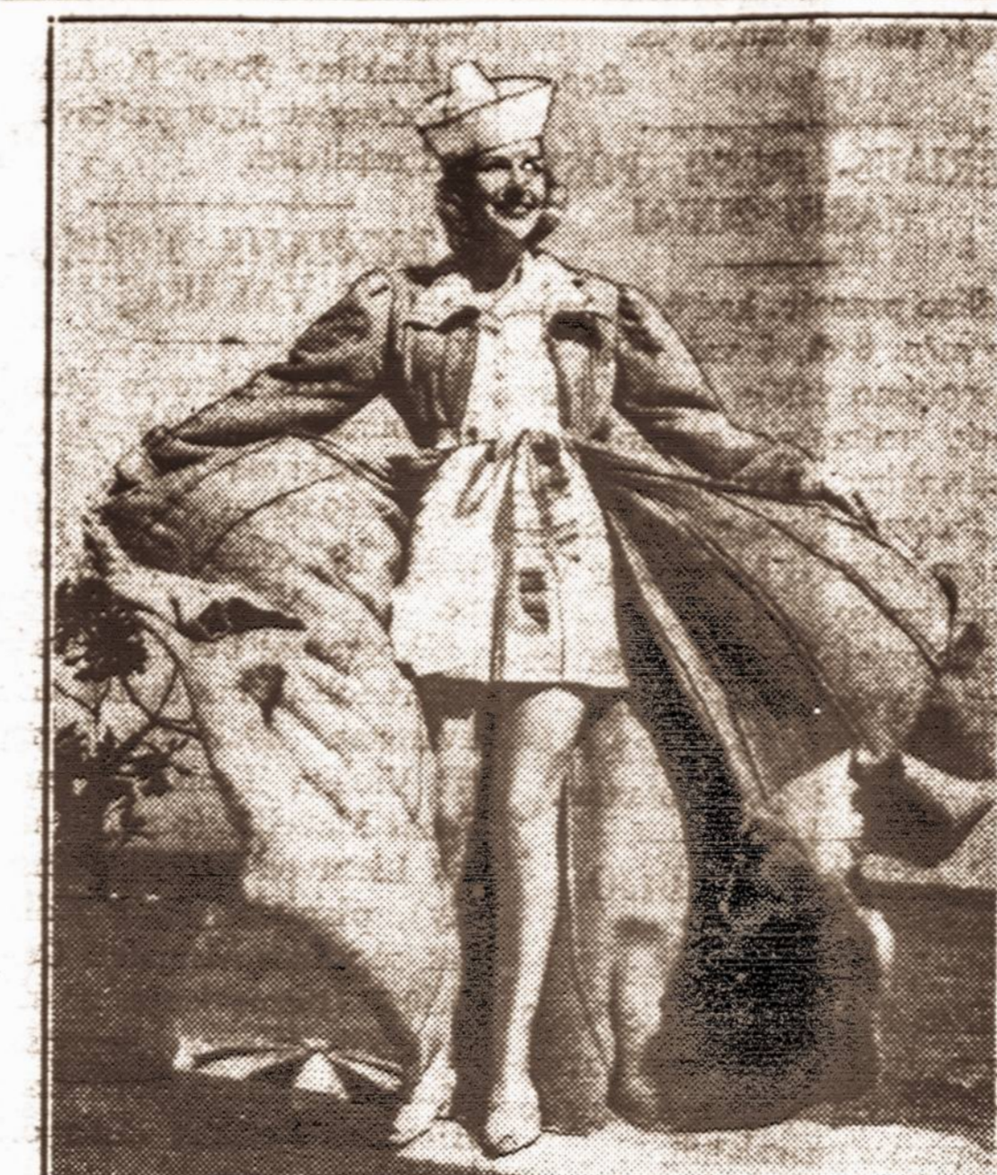
Kada pas mus vieną dieną šalta, kitą lyja, žavingame Floridos pajūryje suvažiavę vasarotojos demonstruoja naujaujas madas. Čia viena New Yorko gražuolių demonstruoja plosėjų, kuriu susisupama ištrūkūs iš gaivinančių jūros bangų.

lės miestu. Jame yra daug senų žmonių, kurie yra nuolatiniai gyventojai, atrodo, kad visi ant senatvės važiuoja apsigyventi į St. Petersburg, Florida. Iš ten važiuoti per Tampa ir į Bok Bokštą, arba kaip vadina Singing Tower. Tai yra labai aukštas bokštas, kuriame yra varpai ir tris kartus į savaitę ten skambinama. Iš ten važiuoti per Orlando, kur galima per visą dieną važiuoti keliu ir iš abiejų pusių kelio matyti tik oranges ir grapefruits. Labai gražus reginys. Toliaus vėl į Daytona Beach ir iš ten į namus.