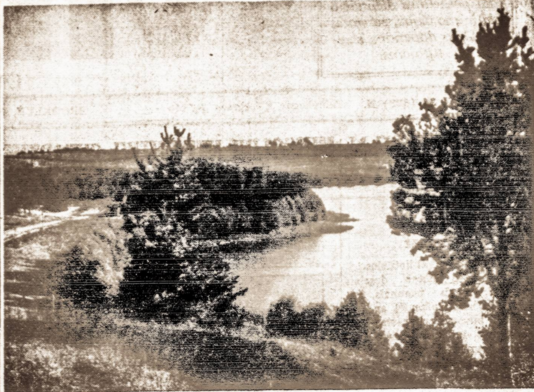
Zarasų apylinkės vaizdelis.

Taigi Vasario 16 dieną minėdami, minėkime ją bent mintimis ir aukomis su tais, kurie