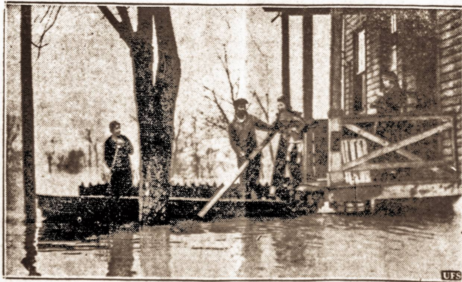
Ohio upės pakraščiuose. — Išsiliejusi iš krantų Ohio upė užliejo žemumas nuo Cin- cinnati iki Missisipi ir sudarė pavojaus 250,000 žmonių. Apie 10,000 šeimynų liko be pastogės.

NUMATOMA: Laipsniškai didėjantis debesuotumas. Sal- čiai. Naktį gali būti sniego. Šulė teka 6:58, leidžiasi 5:24. Dienos ilgis 10 val. 25 min.