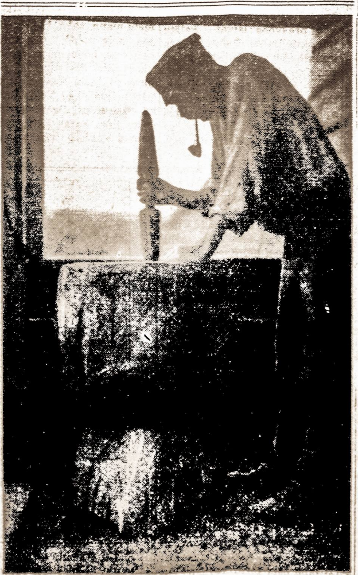
Lietuvoje pasitaiko dar ir šitokių kruopų malyklių, kurios jų šeiminkui tiekia ne tiek malonumo.

Klaipėdoje statomas aerodromas oriniam susisiekimui tarp Kauno ir Klaipėdos - Palangos.