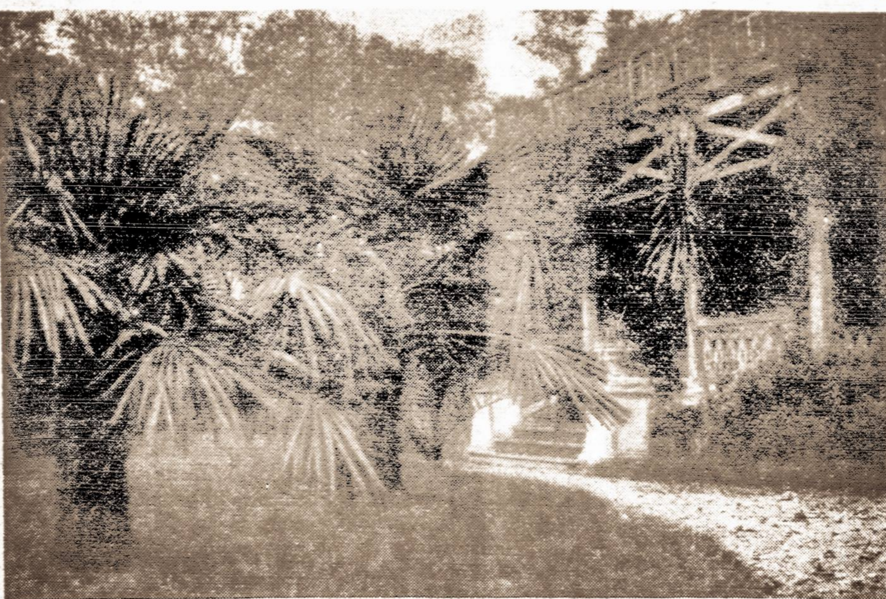
Šių dienų kutūringo ūkio sodyba, papuošta pietų kraštų augmenija.