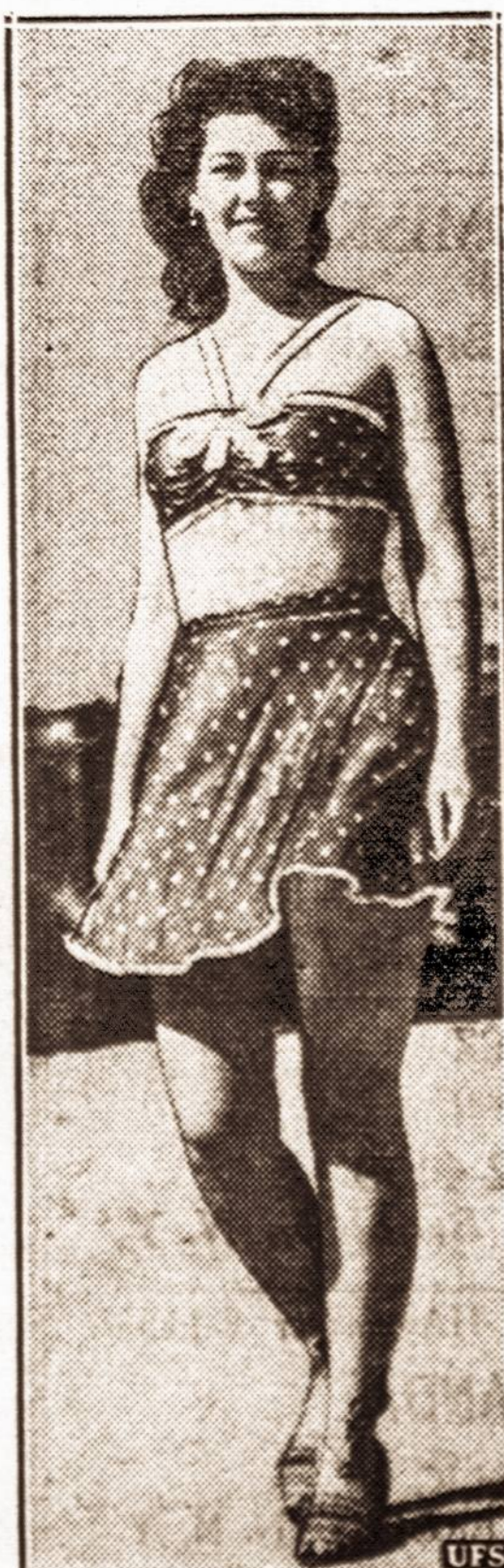
Saulės kostiumas. — Naujas populiarus „saulės kostiumas“, dabar dažnai matomas Miami Beach, Floridoje.