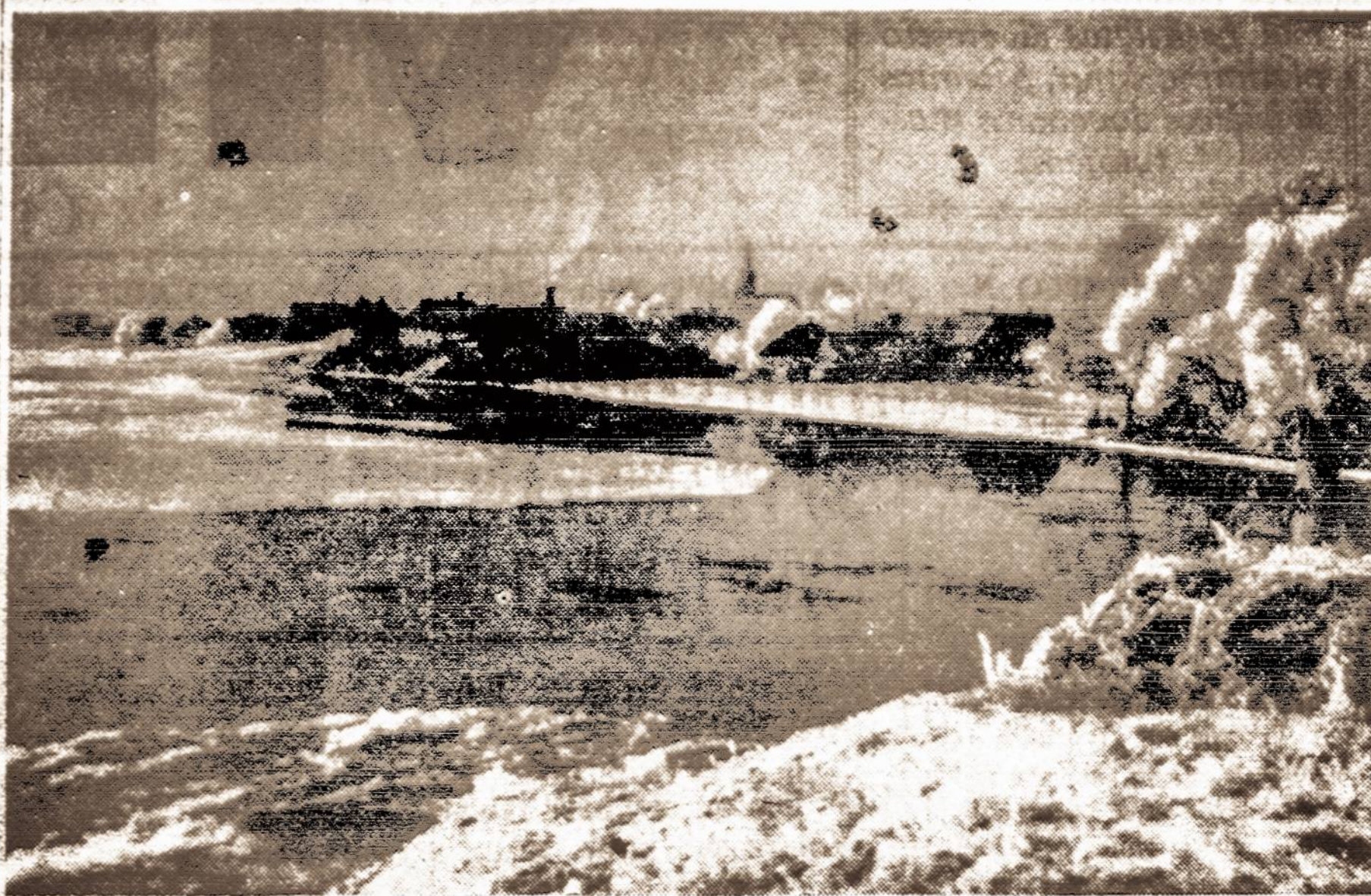
Miestelio prie ežero žiemos vaizdas