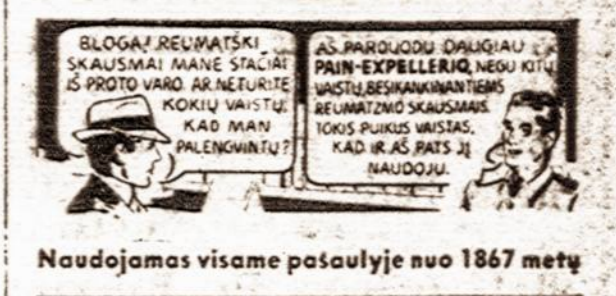
Naudojamas visame pasaulyje nuo 1867 metų

"Komsomolskaja Pravda" su pasipiktinimu rašo, kad Pietų Rusijoje nuolat daugėja vaikų vedybos. Tėvai atima vaikus iš mokyklų ir apvedina, kad nebereiktų jais daugiau rūpintis. Vienoje mokyklos klasėje iš 26 mergaičių nuo 13 iki 14 metų amžiaus metė lankiusios mokyklą net 25 ir tuojau ištekėjo. Samboro apygardoje daug keturiolikos metų amžiaus mergaičių, kurios ištekėjusios ir jau turėjusios vaikų, pareikalavo persikirti į su vyrais, kad galėtų toliau lankyti mokyklą.