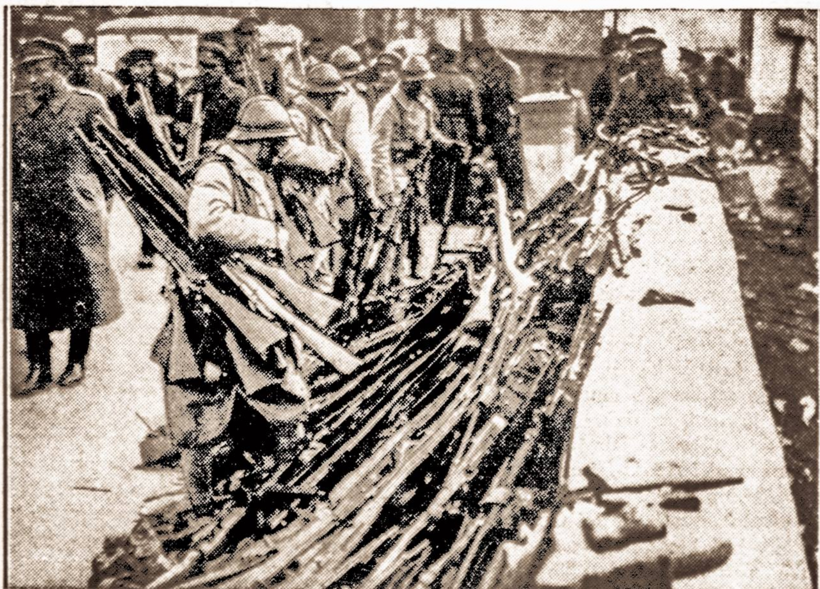
Vyriausybinių ginklų. — Tūkstančiai atbėgusių į Prancūziją Ispanijos vyriausybinių kareivių atidavė ginklus prancūzams.

Vasario 3—5 d. Rygoje įvyko Baltijos turizmo konferencija. Buvo svarstomi turizmo propagandos, turizmo reikalų atleistas iš tarnybų visos moterys, kurių vyrų gautu di-