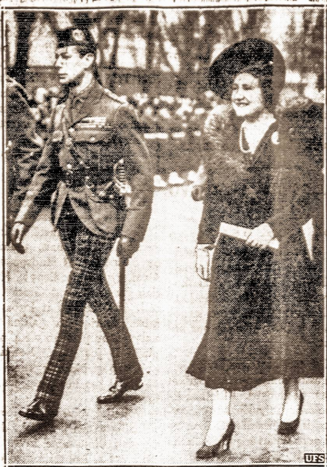
AT DEDICATION—Wearing tight-fitting trousers, here is King George of Great Britain, with smiling Queen Elizabeth, leaving St. Andrew's Presbyterian church at Aldershot, England, after dedication of a new wing in memory of soldiers killed in the World War. Later they reviewed four Scot regiments.