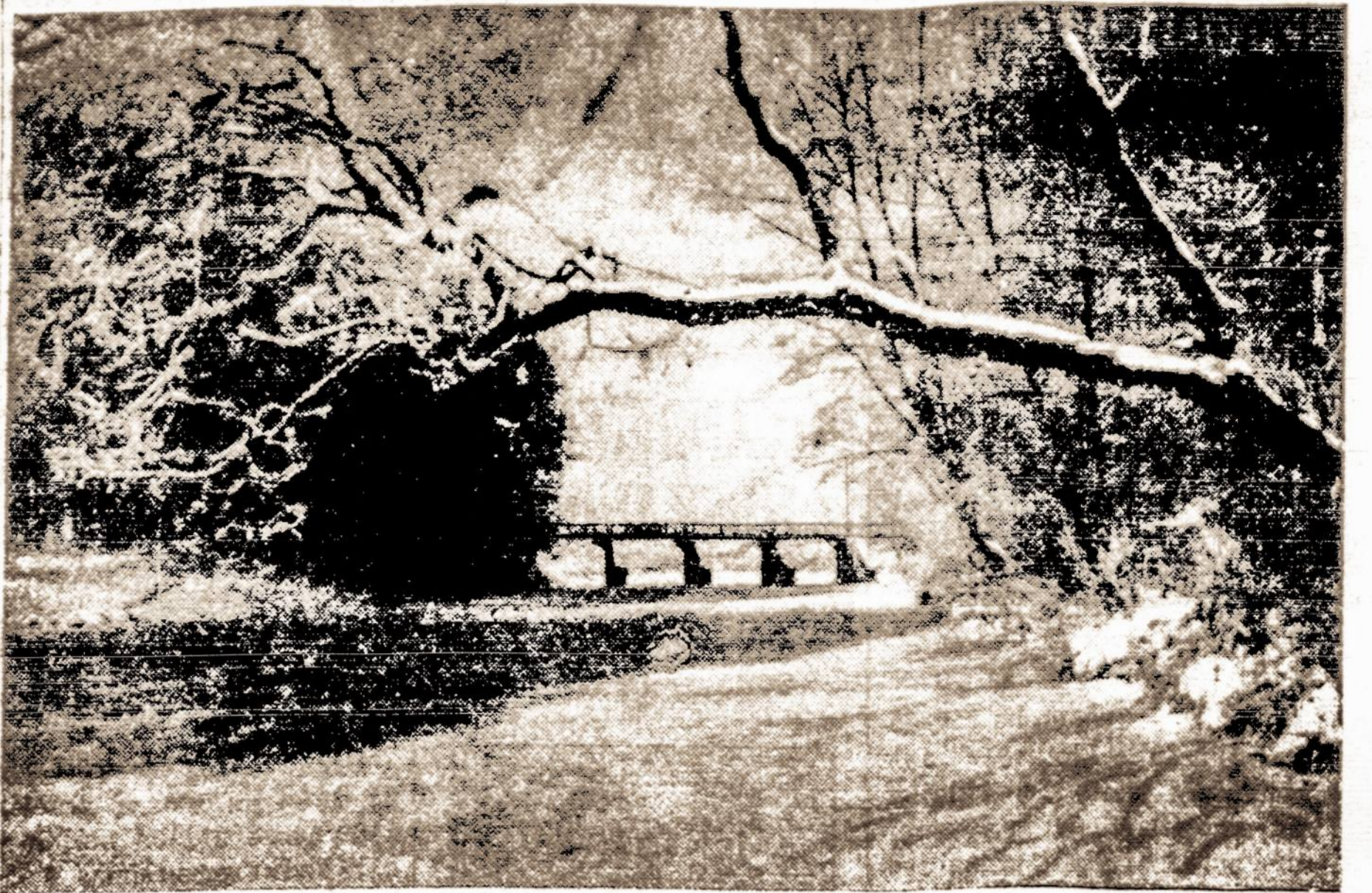
Ir Mažosios Lietuvos upės, per kurias anksčiau nebuvo pra važiavimo, dabar jau turi gražius, tvirtus tiltus tiltelius. Čia vieną tokį tiltą matome.

Estija nuolat palaikė gražius kaimyninius santykius su savo Pabaltijo kaimynais. 1934 m. pasirašytoji bendradarbiavimo sutartis vis plačiau gilina bendradarbiavimą. Jau kelį metai kaip Estiją valdo tautiškoji vyriausybė, kuri,