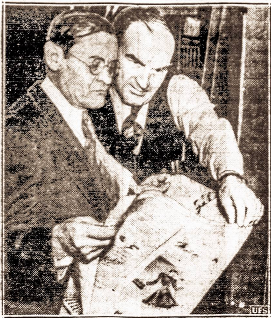
Laikraštine popiera iš atmatų. — Šiomis dienomis Philadelphiaje išmėginta nauja laikraštine popiera iš atmatų. Ši popiera daug pigesnė už iki šiol vartojamą popierą.