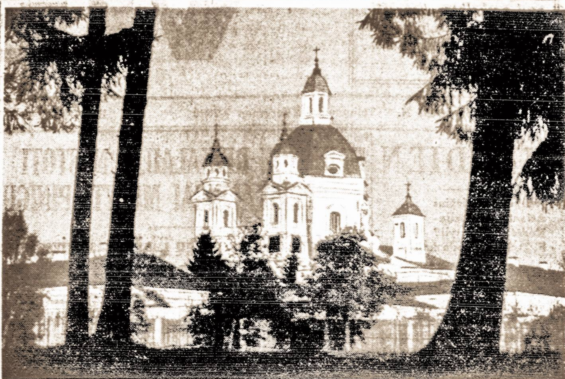
Garsusis Pažaislio vienuolynas ties Kaunu. Jis yra vienas žymiųjų pastatų Europoje. Čia palaidotas generolas Lvovas, carų Rusijos himno "Bože caria chrani" kūrėjas.

Is eilėraščių rinkinio "Diemedžio žydėsiu"