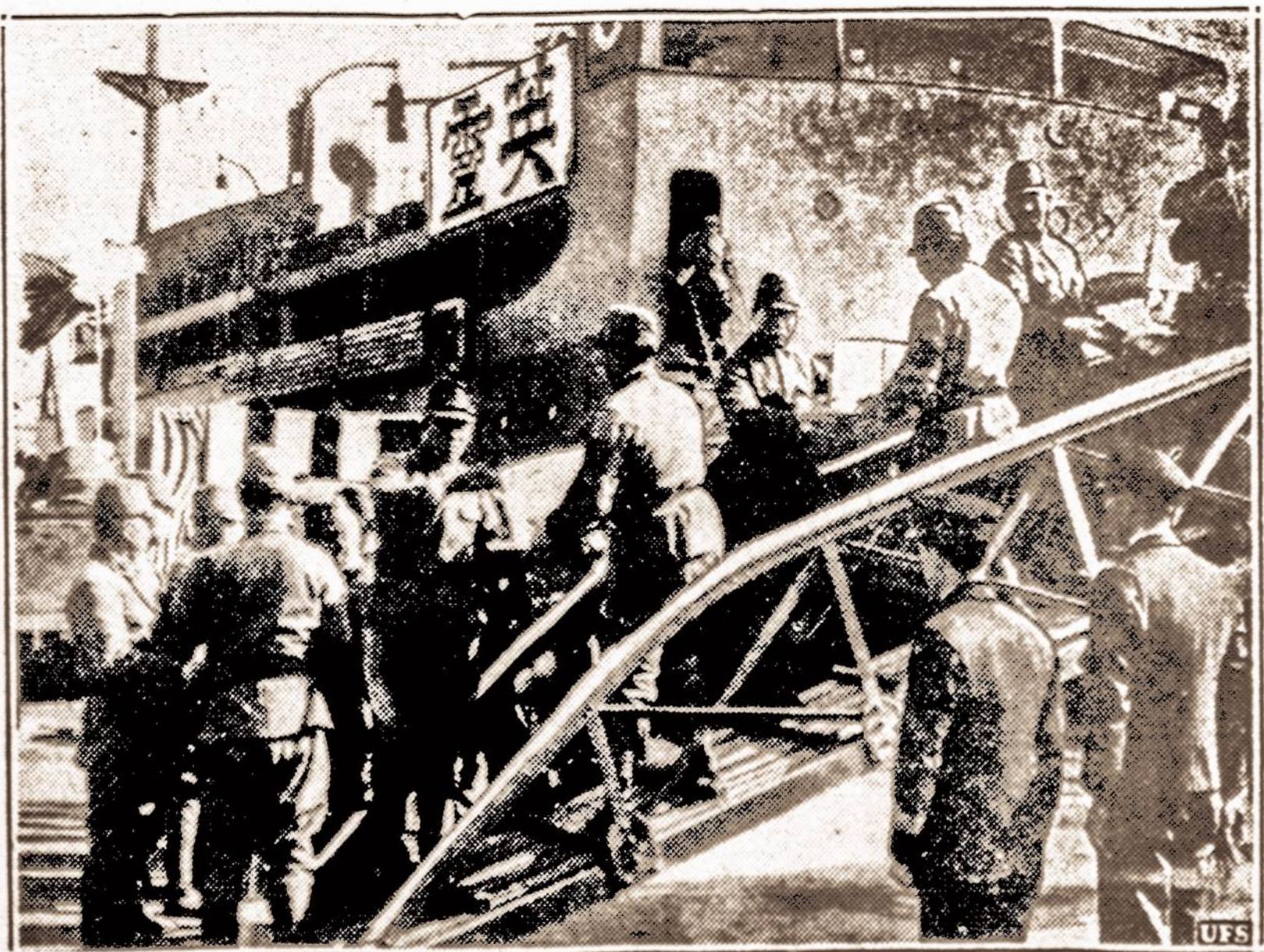
Herojų palaikai. — Japonų laivas pasirošęs grįžti iš Shanghajaus į Japoniją su karo lauke žuvusių karių palaikais. Japonai pareiškė, kad Kinijoje iki šiol žuvo 166 tūkstančiai jų kariuomenės, bet pašaliniai karo stebėtojai pareiškė kad žuvusių skaičius siekia netoli 600 tūkstančių.

NUMATOMA: Lietus, daug šalčiau popietyje ar naktį. Saulė teka 6:29, leidžiasi 5:48. Dienos ilgis 11 val. 19 min.