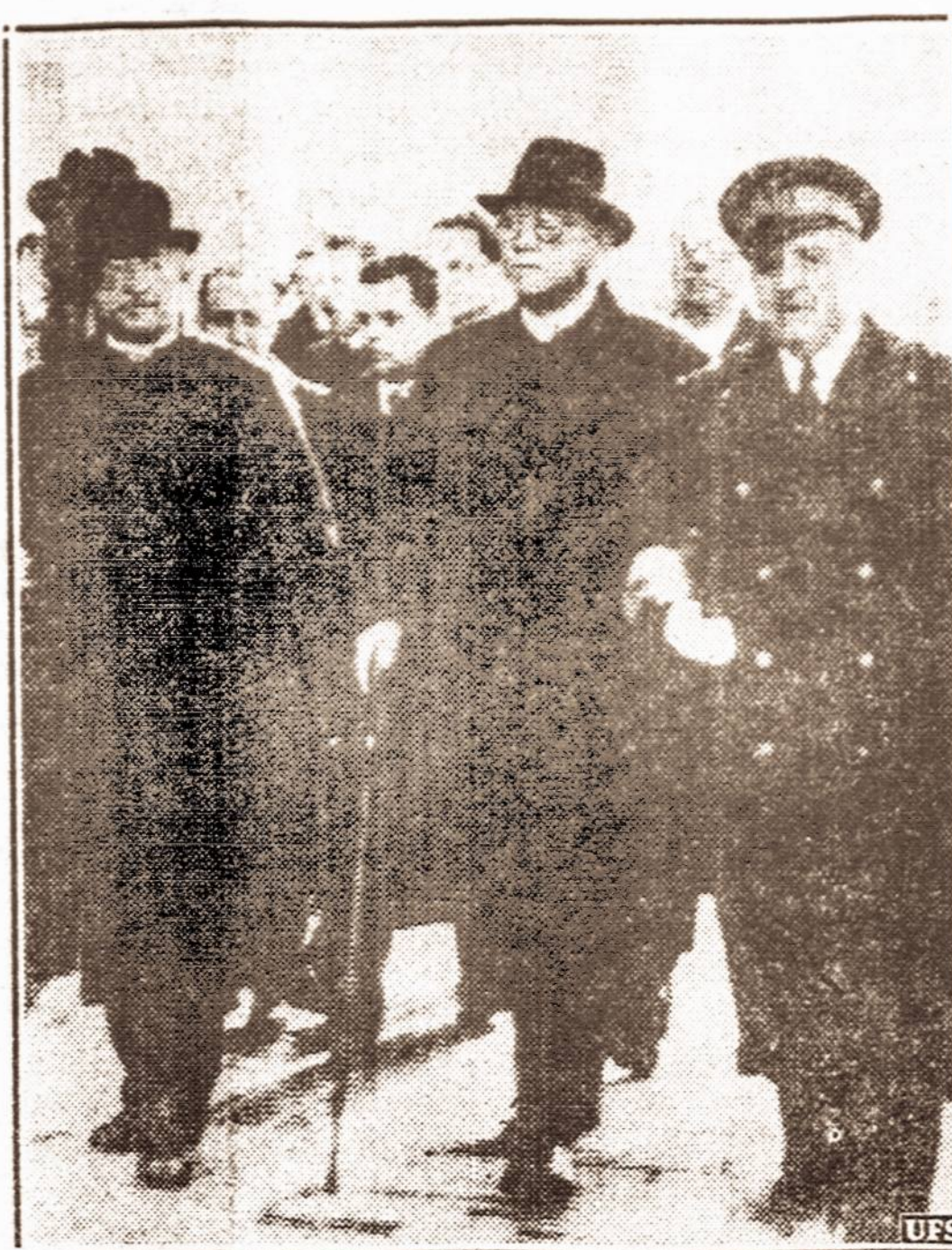
Amerikos vyskupas atvyksta į Romą. — J.A.V. Kardinalas O'Connell atvyksta į Romą. Jis dalyvavo naujojo popiežiaus rinkimuose. Paveikslas persiųstas į Ameriką per radiją.

Sakoma, kad Vokietija per vieną mėnesį pastato nuo 500 iki 600 karo lėktuvų.