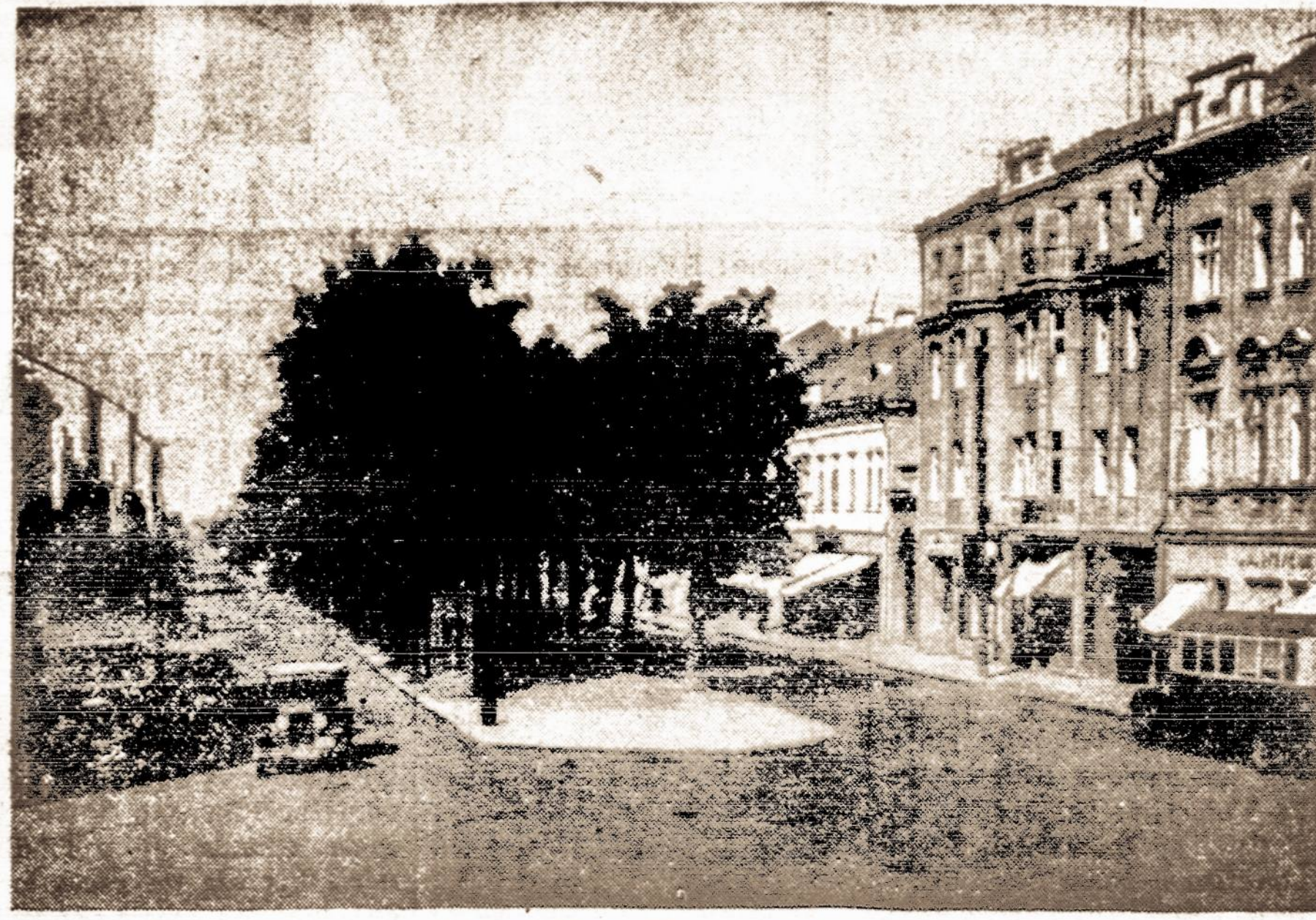
Lašvės Alėja Kaune ties Iglu os bažnyčia.