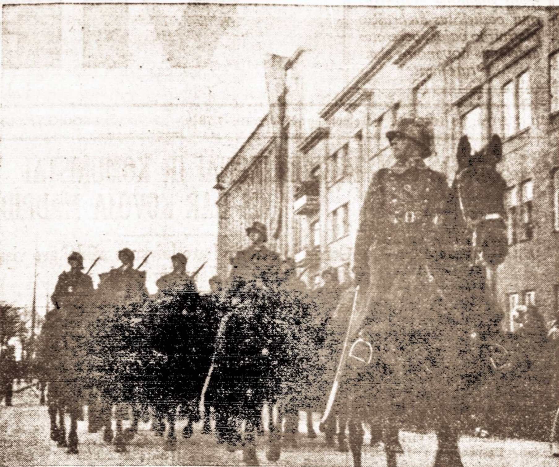
Lietuvos šauiniųjų raitelių būrys vasar. 16 dieną Kaune ati duoda pagarbą Nežinomojo Kareivio kapui.

Taktikos su kitomis tautininkų grupėmis Sandara nepaaiškina, bet nurodo, kad sandariečių tikslas esąs "stiprinti visomis priemonėmis viską, kas nukreipta pagerinti Amerikos lietuvių kultūrinę ir ekonominę būklę: palaikyti tautinį susipratimą, o su kitomis srovėmis elgtis taip, kaip jos elgiais su mumis". Vyt. Širvydas