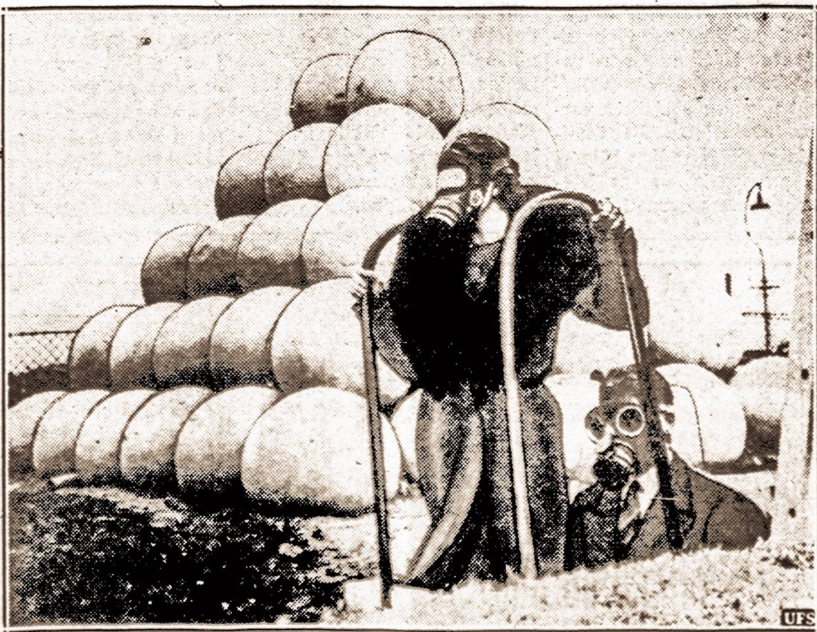
Slėptuvė. — Anglijoje dabar smarkiai įrengiamos priešdujinės ir priešbombinės slėptuvės. Čia matyti kaip du kaukiuoti vyrų iš slėptuvės. Dideli betoniniai skrituliai ant slėptuvės, sumažina sprogstančių bombų jėgą.

NUMATOMA: Giedra. Mažas pasikeitimas temperatūroj. Saulė teka 6:18, leidžiasi 5:57. Dienos ilgis 11 val. 7 min.