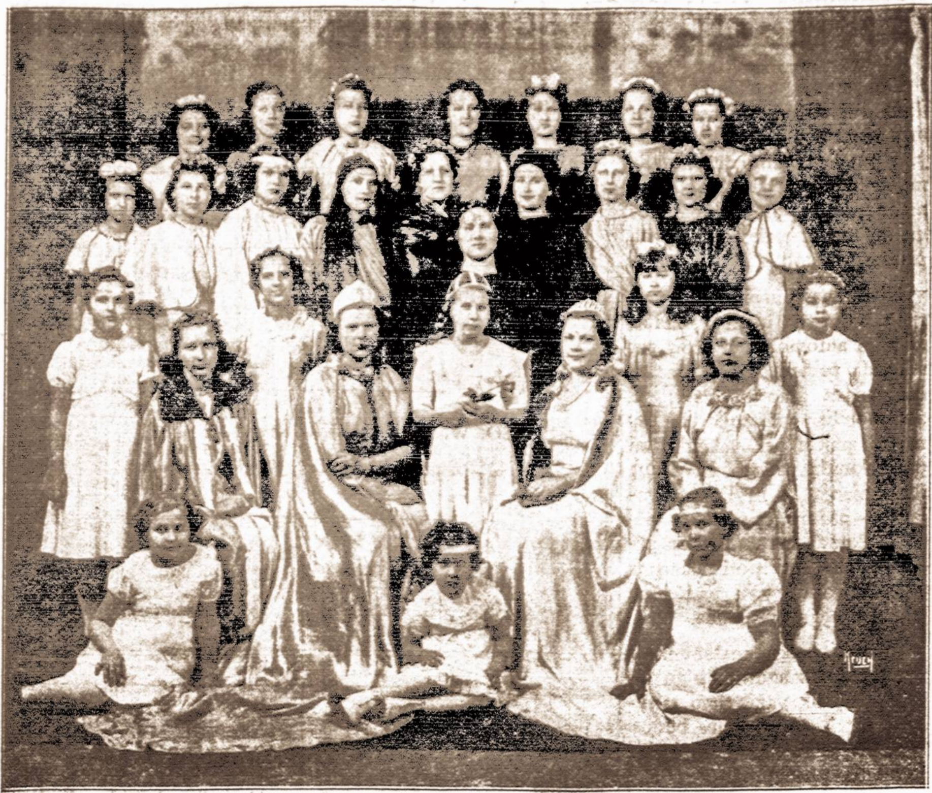
Central Brooklyno Sv. Jurgio parapijos choro vaidintojos, vaidinančios veikale "Piloto Duktė", vadovaujant muz. J. Brundzai. Vaidinimas įvyksta šį seštantdienį, kovo 11 d., Sv. Jurgio parapijos salėje, 207 York St., Brooklyne, 7:30 val. vakare.