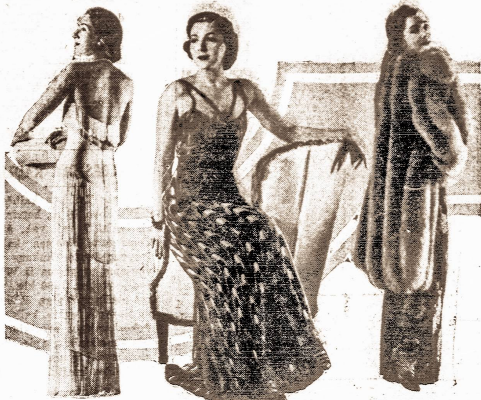
Naujausios šilko suknioms. — Gražuolė artistė June Clayworth demonstruoja naujausią išėiginę suknią, kuri yra iš sunkaus šilko.

no kaulus, kraują, smegenis ir visus kitus tos aukos organus per ką jiems tenka tos maisto dalys, kurių mes negauname bevalgydami vieną ar kitą parinktą šmotelį mėsos. Tokiu būdu, kad tą trūkumą mineralų, įvairių druskų ir reikalingų sistemai vitaminų papildymui mes turime valgyti ganėtinai žalių daržovių ir šviežių vaisių. Tad pasirūpinkime pažinti vertę valgomų produktų, kurs taip reikalingas, gyvybės ir sveikatos palaikymui, o naują turėsime didelę.