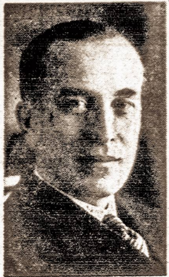
Lietuvos Užsienių Reikalų Ministras Urbšys.

Lenkai sako, kad Lietuvos vyriausybė tarėsi su Varšuva Lietuvos krašto apsaugos reikalais