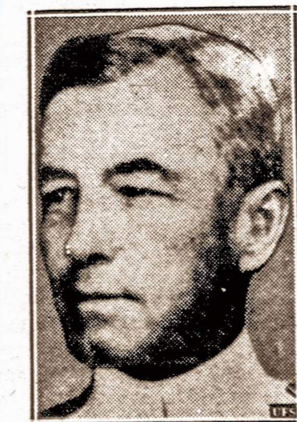
Naujas admiralas. — Harold R. Stark, šiomis dienomis pakeltas į admiralus.

Iš lenkų šaltinių praneša, kad Voldemaro šalininkai vėl pradeda veikti Lietuvoje ir Klaipėdos krašte. Taip pat skleidžiami gandai, kad Lietuva būtų prasiūsi Lenkijos apginti Lietuvą nuo vokiečių užpuolimo, bet tą žinią oficialūs šluoksniai užginčija, kaip prasmiamą.