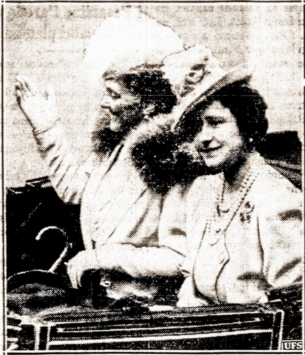
Svečiuose Londone. — Anglijos Karalienė Elzbieta ir Prancūzijos prezidento žmona Mm. Lebrun Londone. Prancūzijos prezidentas keleta dienų su savo žmona viešėjo Londone.