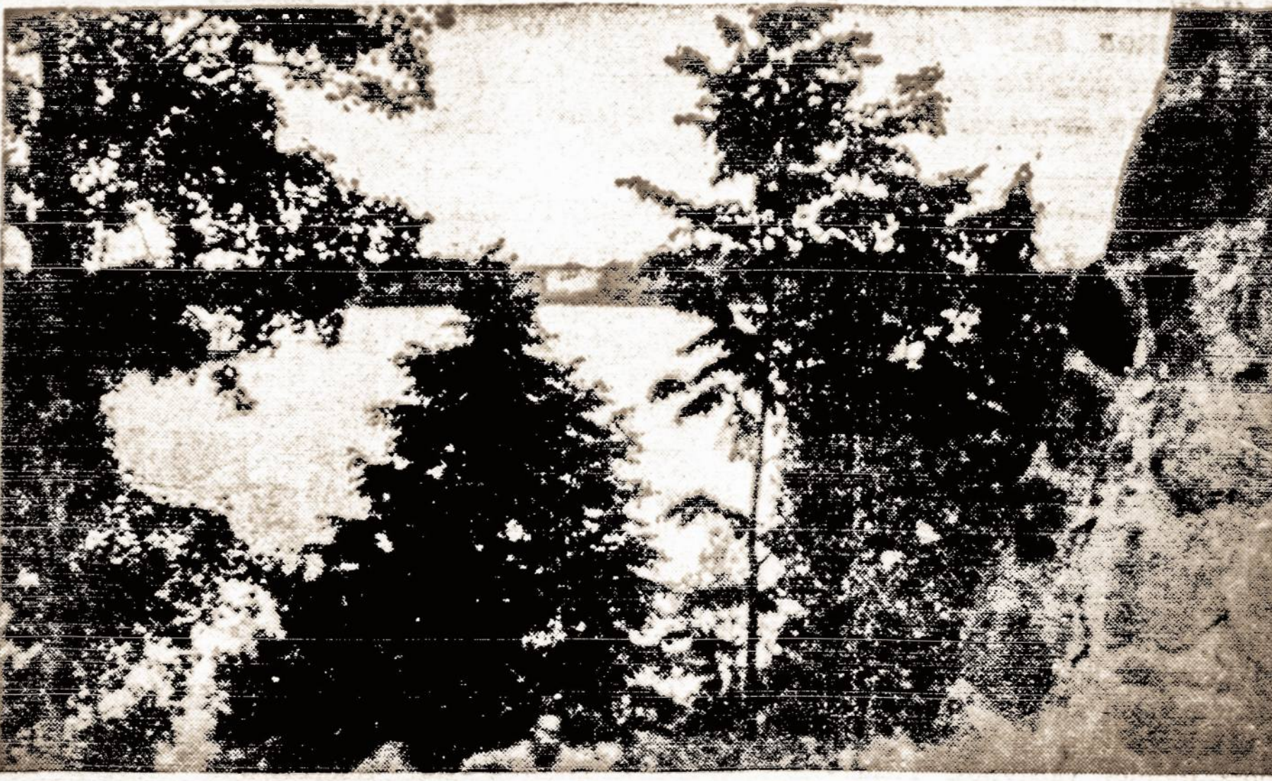
Vilnijos vaizdai. — Zavingas g amtos kampelis ties garsiąja Trakų pilimi.

Buvusis Vokietijos kaizeris Vilhelmas II gimė 1859 m., užėmė sostą 1888 m., viešpatavo 30 m., nuvirto nuo sosto turėdamas 59 metus amžiaus. Sudėjus šias skaitlines gauname 3836 galutiną skaitlinę, kuri padalinus pusiau gauname 1918, tai yra tų metų skaitlinę, kuriais kaizeris nuvirto nuo sosto.