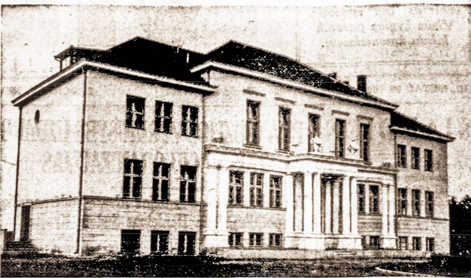
Pradžios mokykla Užulėnyje, Umergės apskrityje. Panašių mokyklų Lietuvoje jau yra apie 900. Bet dar didesnė pradžios mokyklų dalis tebėra skurdžiose patalpose.