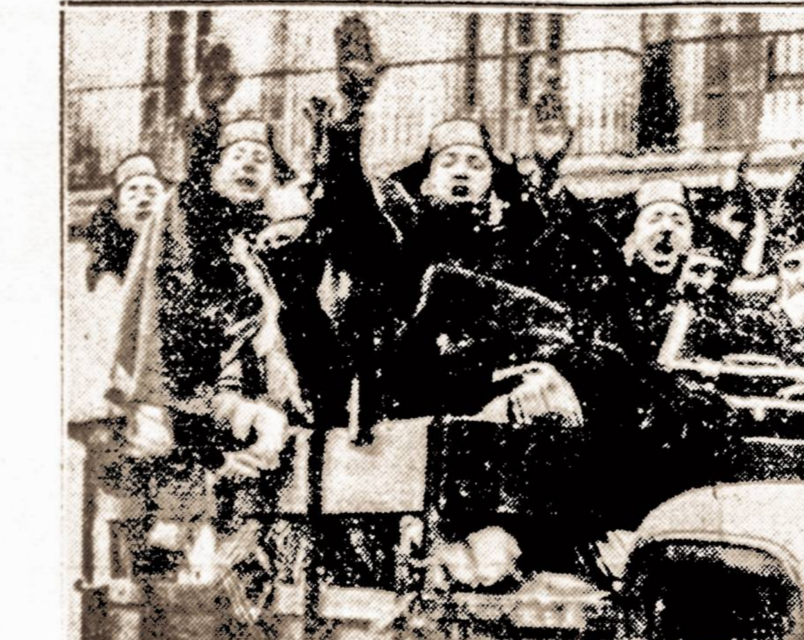
Ispanijos falangistai. — Grupė Ispanijos fašistų falangistų, kurie važiuodami Madrido gatvėse atiduoda pagarbą falangistų papročiu.

Klaipėda tuo būdu nustosianti mažiausiai 50% savo apyvartos. Taigi, ši kraštą laukianti nelaimė šviesi ekonominė ateitis.