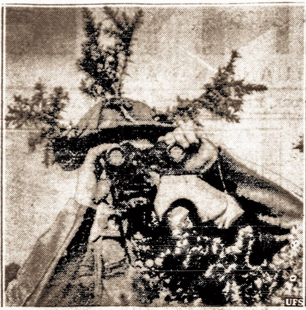
Anglas manevruose. — Anglijos kareiviai manevruose išbando visokius kamoflažo būdus. Čia matyti vienas kareivis su medžio šakutėmis ant plieninės kepurės.

Gaila, kad kitų apylinkių SLA veikėjai ir nariai nepritaria šiam SLA viršininkų žygiui. Bet svaidymas priekaištais tautininkams ar kitai kuriai srovei šiuo klausimu yra vien pigi socialistų ir komunistų demagogija. Šis priešingumas paremtas apylinkių patriotizmu, o ne srovinių nusistatymu. Kaip mūsų apylinkėje visų srovių SLA nariai pritaria ir džiaugiasi SLA centro kėlimu į Pittsburghą, taip kitų apylinkių visi SLA nariai nepritaria tokiam kėlimui. Jokia srovinė grupė nei valdžiai skundų siuntinėjo, nei kitaip priešingumo nepareišė. Patys SLA nariai savo organizacijos centro kėlimo klausimu kovoja ir savo apylinkių garbė gina. Taigi komunistų ir socialistų demagogija prieš tautinę srovę visi SLA nariai suprantą ir doresnėji tuomi piktinasi.