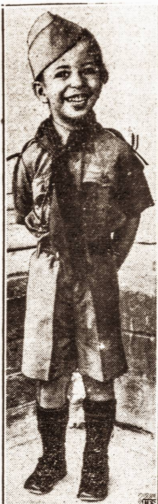
Irako karalius. — Trijų metų amžiaus Irako karalius Faisal II. Jo tėvas žuvo automobilio nelaimėje.

Sako, pasaulyje negali, būti vietos politikai, kuri siekia kitas valstybes pavergti