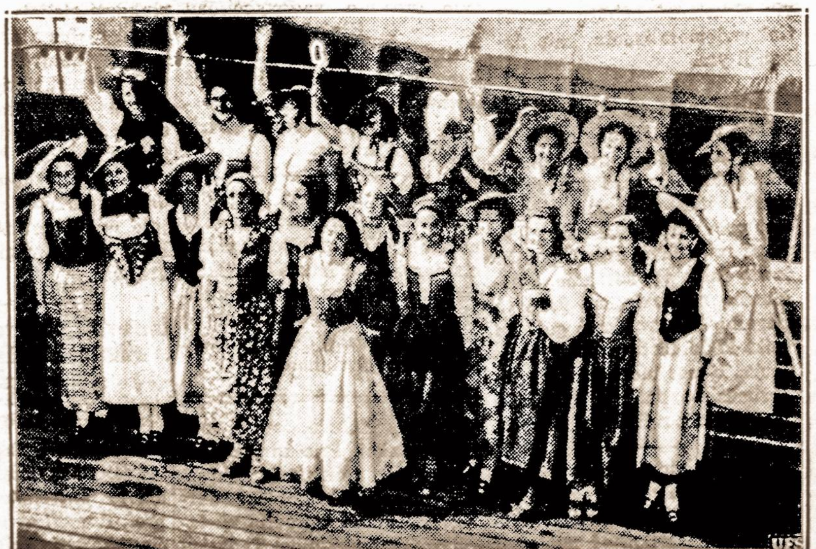
Šveicarietės parodoje. — Į New Yorką šiomis dienomis atvyko grupė šveicarietė, kurios bus šveicarių pavilijone. Jos sako, kad nori parodyti amerikėnams, kaip šveicarietės moka linksintis.