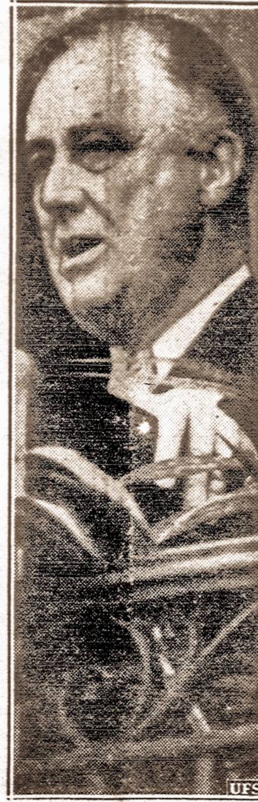
Prezidentas. — Franklyn D. Rooseveltas kalba Amerikos Raudonojo Kryžiaus konvencijoje. Jis smerkė valstybes, kurios jėga nori dominuoti pasauly.

Balandžio 24 dieną Berlyne prasidėjo Lietuvos-Vokietijos derybos Lietuvos zonai Klaipėdos uoste įsteigti.