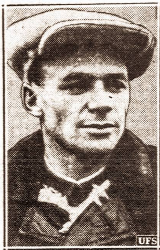
Lakūnas. — Sovietų Sąjungos lakūnas majoras Vladimir Kokkinaki, kuris rengiasi iš Maskvos atskristi į Pasaulinę Parodą.

Vokiečiai ir italai juokiasi iš anglų privalomos karo tarnybos ir kareivių