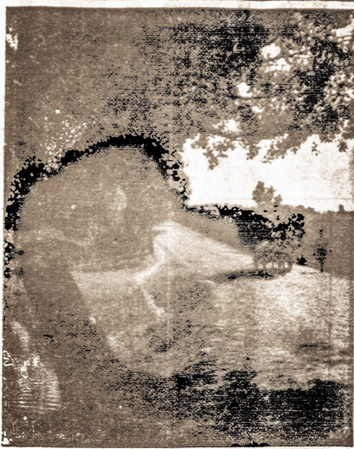
Vilnijos vaizdai. — Kaimo vieškelis

Todėl ir Naujajai Gadynei (tarp kitko) pravartu būtų pasiekti tautinę spaudą ir neškelbti savo sapnų apie Lietuvą, kol "aiškesnės žinios iš Lietuvos" jų nepatvirtins. Kitaip, geltonlapis Keleivis išmintingumu pralenks Naująją Gadynę.