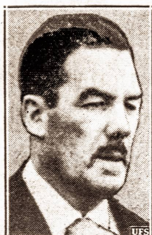
Pirmininkas. — New Yorko Pasaulinės Parodos pirmininkas Grover Whalen.

Baigęs dvejus prakalbas kancleris Hitleris išvyko į savo poilsio vietą Berchdesgadene