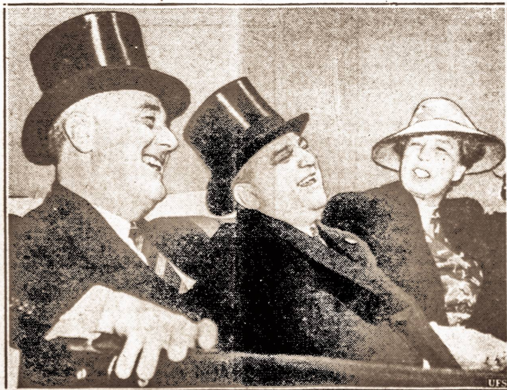
Paroda. — Prezidentas Rooseveltas, New Yorko miesto mayoras La Guardia ir prezidento žmona, vyksta į New Yorko parodą.

KLAIPEDA. — Klaipėdos valdžios organai paskelbė įstatymą, sulig kuriuo žydų ir kitų valstybės priešų apleisti, niekieno nebetvarkomi ūkiai ir kitos įmonės bus atiduodami tvarkyti valdžios skiriamiems valdytojams.