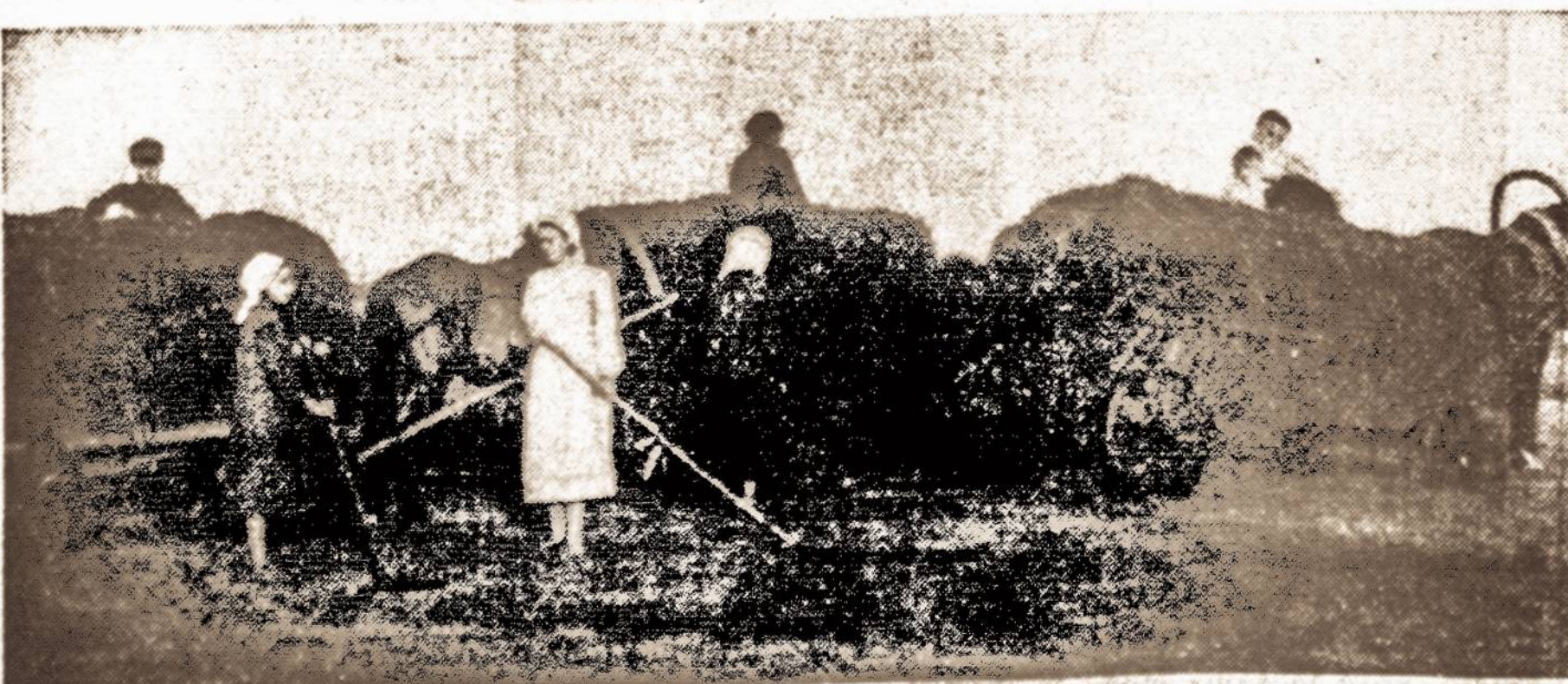
Darbūtūs švenčioniškiai (Vilniaus krašte) baigia paskutiniuosius šienapiūtės darbus.

Italijos vyriausybė perdavė Sovietams naują karo laivą statytą Italijoje, kuris pavadinamas "Taškent". Laivas yra vienas iš moderniausių Rusijos karo laivų.