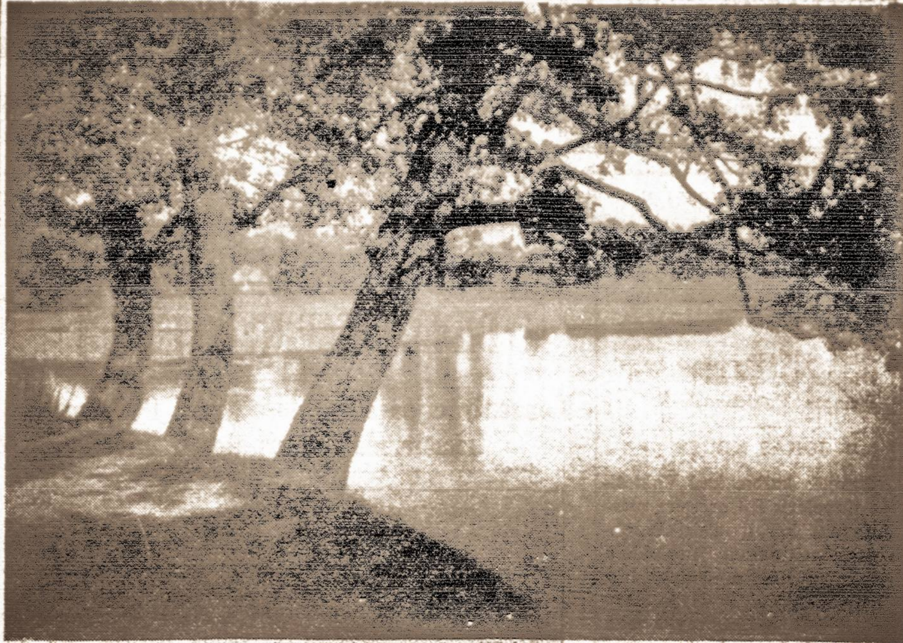
Vilniaus krašto Naručio ežero pakrantės, puošnios svyruokliams berželiais.