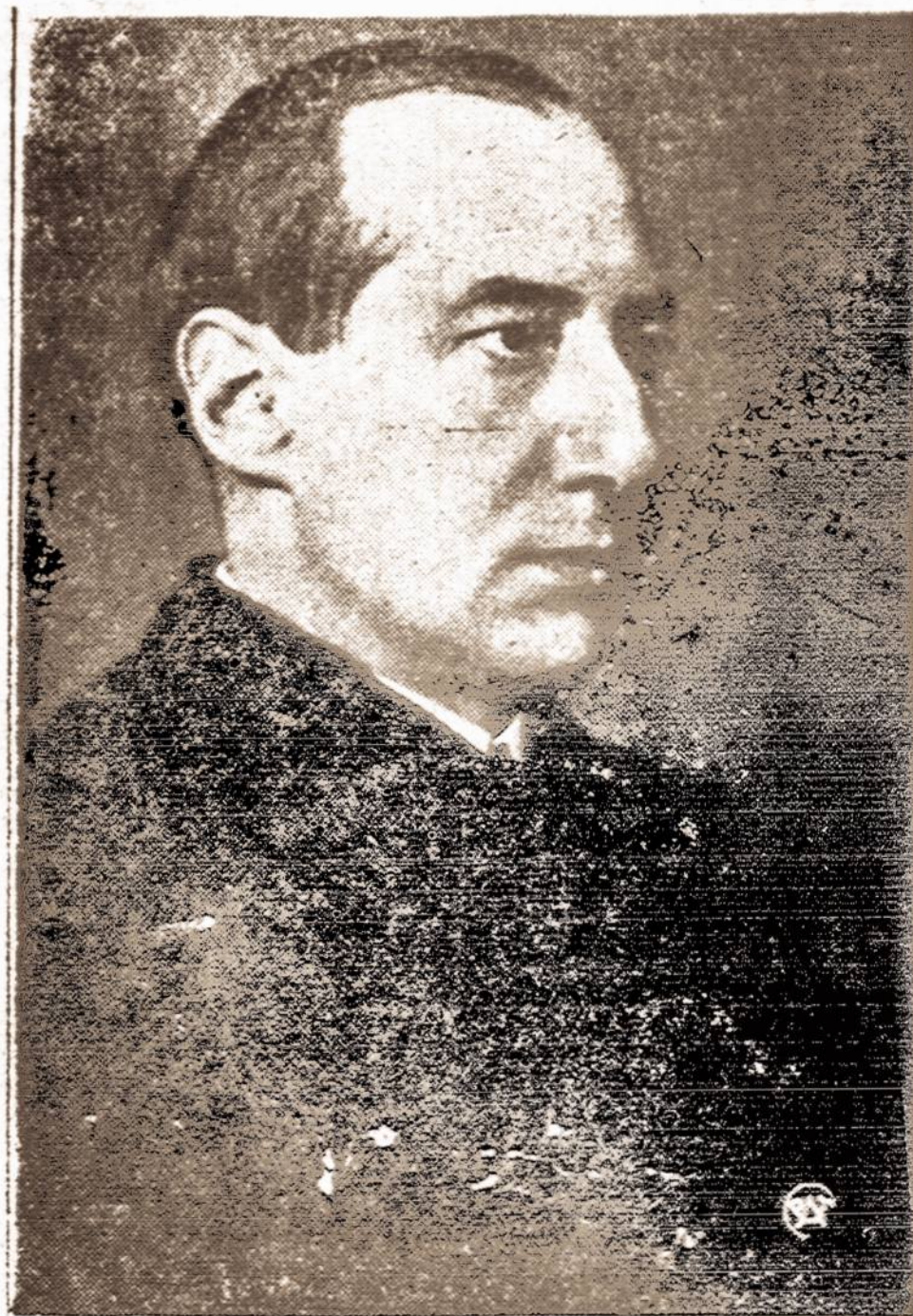
Pulk. Beckas. — Lenkijos Užsienio Reikalų Ministras.