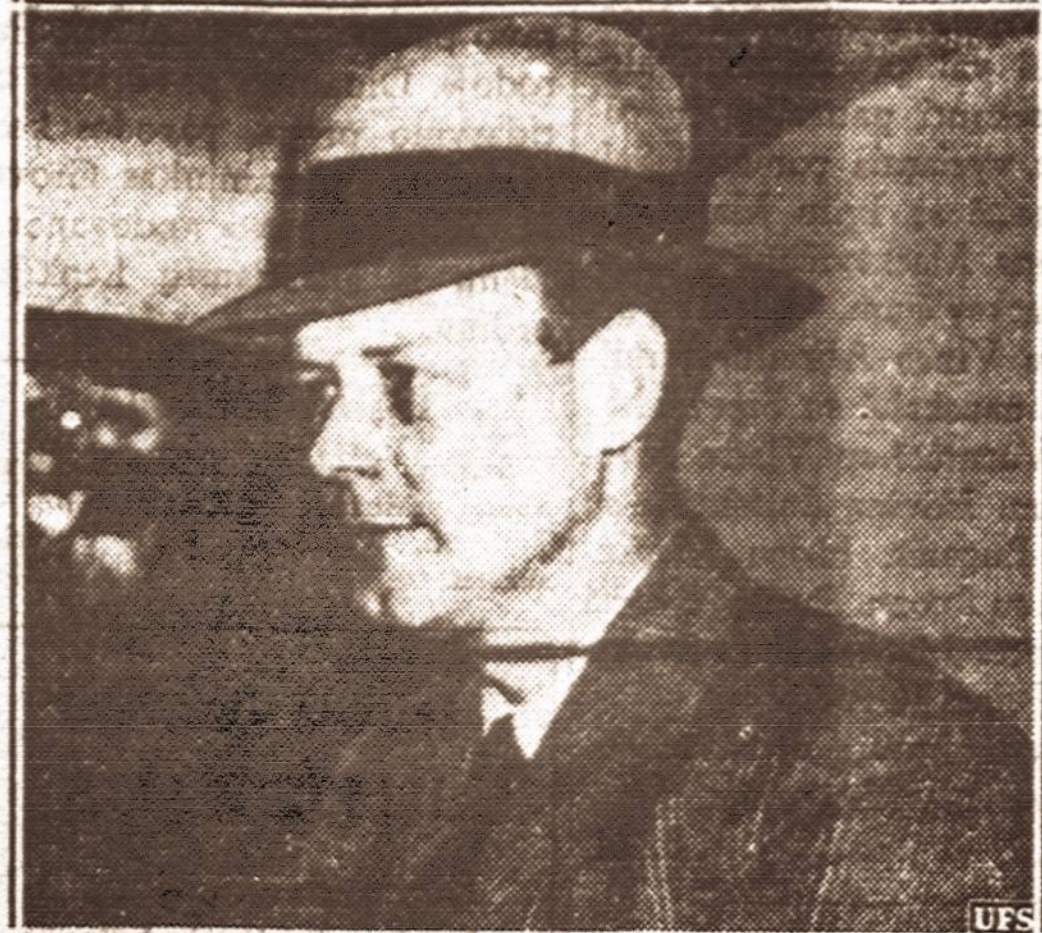
Col. Charles Lindbergh was called on to aid Congress in drafting neutrality legislation designed to keep this country out of war if a conflict breaks out in Europe.

No country favors a tie-up with Russia if it can be avoided, neither should the Lithuanians, favor it, because it would probably mean that in case of attack by Germany, Russian troops would march immediately into the country attacked; and once there, they might remain.