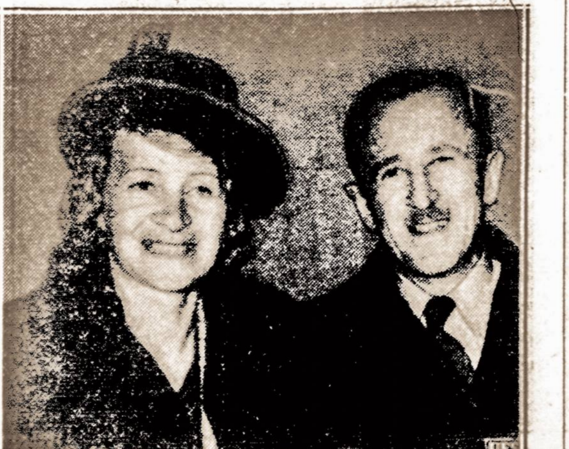
Moscickio dukterė. — Šiomis dienomis į New Yorką atvyko Lenkijos Prezidento Moscickio dukterė. Ji yra Lenkijos Susisiekimo Ministro Bobkowskio žmona.

Gegužės mėnesį Sveicarijoje įvyks Tarptautinė Darbo Konferencija. Toje konferencijoje dalyvauti yra pakviestas ir Lietuvos suinteresuotos įstaijos: Vidaus Reikalų Ministerija, Darbo Rūmai, Prekybos, Pramonės ir Amatų Rūmai.