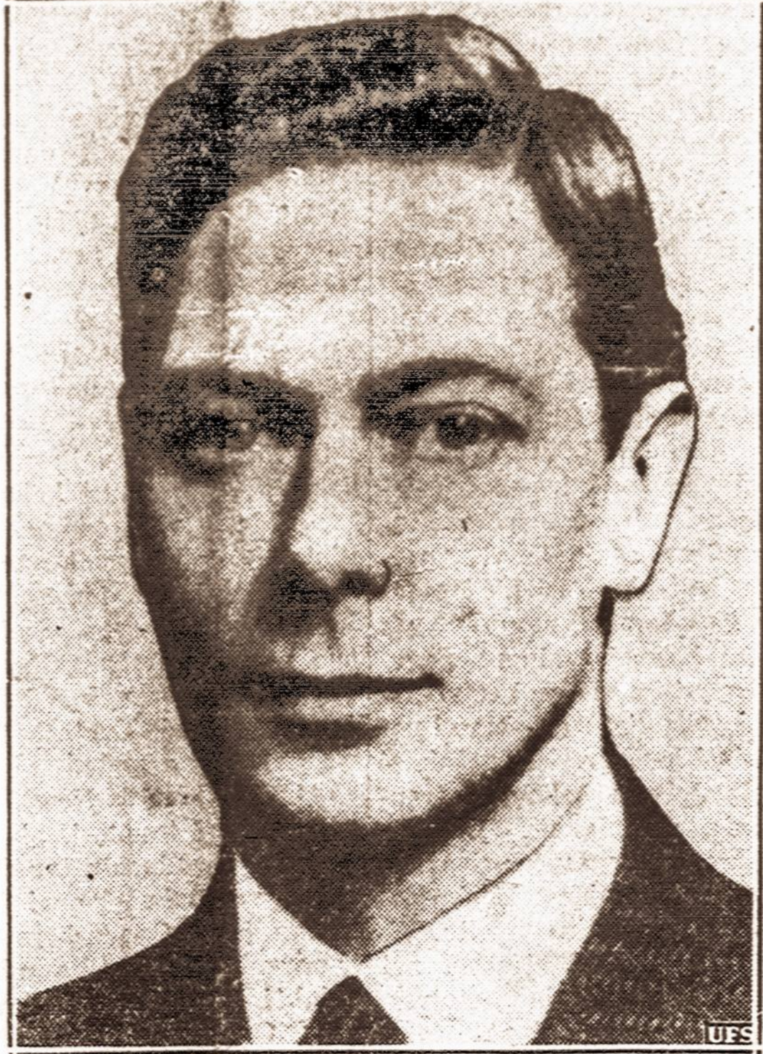
Atvyksta. — Anglijos Karalius Jurgis VI, kuris kartu su karaliene turėjo išplaukti iš Portsmouth, Anglijos vakar, geg. 7 d. Jis ir karalienė aplankys Kanadą ir Jungtines Amerikos Valstybes.

kad Prezidentas Rooseveltas privertė J.A.V. kariuomenės vadą Gen. Craig pasišalinti, o į jo vietą pasiskyrė Gen. Marshall, kuris klausys savo viršininko prezidento įsakymų. Buvo ir kitas kandidatas, kurio norėjo kai kurie Kongreso sluoksniai tai Gen. Drum. Bet Rooseveltas pasidareš išvadą, kad Gen. Craig nepaklusus, Gen. Drum perdaug galvoja, o Gen. Marshall, kaip geram kareiviui pridera, klauso savo viršininko.