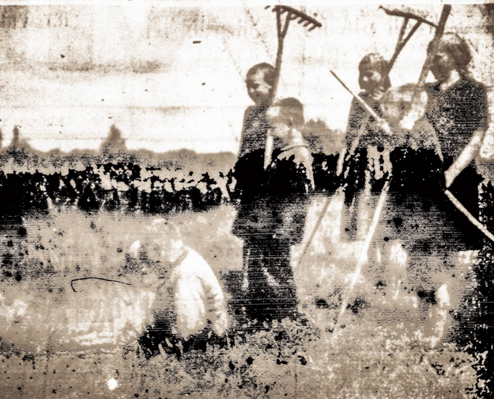
Jaunesnieji Vilniaus krašto lietuviai grebėjėliai kaitrią vasaros dieną marina troškuli.

Atgavus laisvą spausdinimą žodį Lietuva atsikvėpė. Viena kova buvo laimėta. Toliaus sekė antra — Lietuva atgavo savo nepriklausomybę. Šiandien Lietuvoje spausdintas žodis lanko kiekvieną miestelį, kiekvieną valstietį. Visi džiaugiasi juo. Per tuos trisdešimt penkis metus nuo spaudos atgavimo, Lietuvos spausdintas žodis padarė milžinišką progresą.