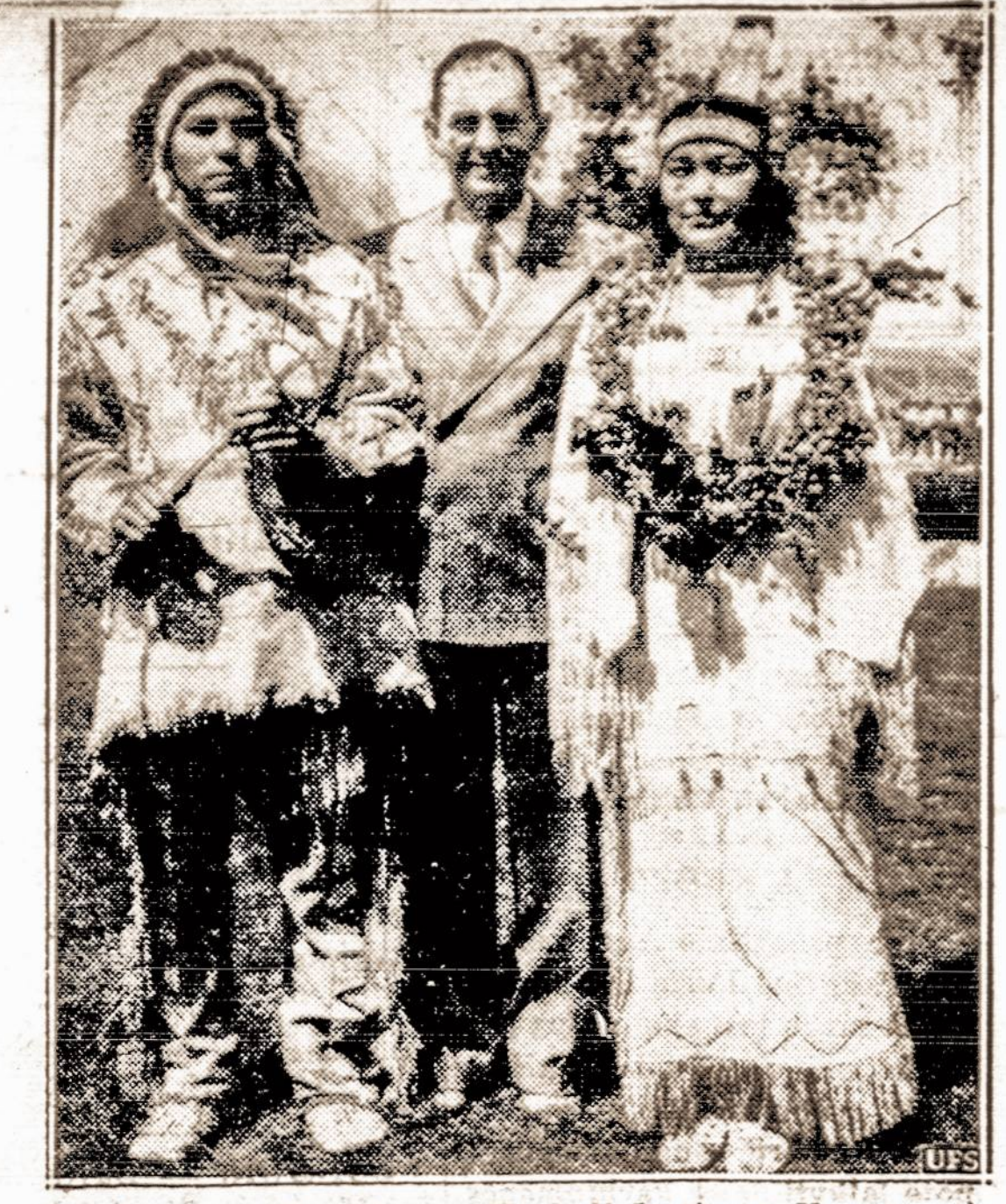
Tikrieji amerikoniai. — Haskell Institute, Kansas valstybėje išrinkti du tipiški indėnai vyras ir moteris.

Jungtinės Amerikos Valstybės yra turtingiausias kraštas pasaulyje. Vienok jokioje kitoje pasaulio valstybėje nėra taip apibristas biednuomenės globėjimas kaip Amerikoje.