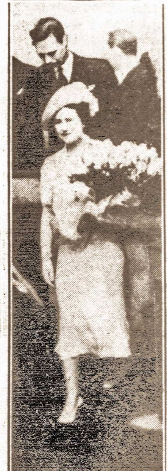
Quebec. — Karalienė Elzbieta nuolaidų estrados iškilmių metu.

KAUNAS (Elta). — Kaune šalia geležinio tilto nuo Čiurlionies gatvės į Aleksotą statomas elektrinis keltuvais, kuriuo per Nemuną vienu sykiu bus galima perkelti 250 žmonių arba 12 vežimų. Keltuvais baigiamas statyti gegužės 15—16 dienomis.