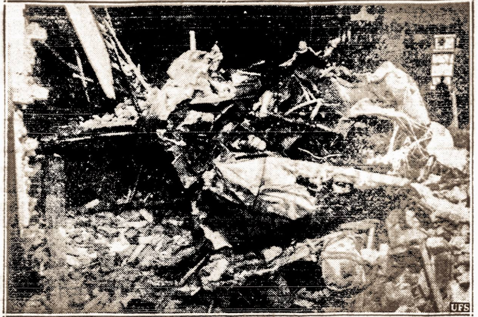
Du lakūnai žuvo. — J.A.V. karo lėktuvo avarijoje žuvo du karo lakūnai. Nelaimė įvyko ant Hamilton kalno, Kalifornijoje. Lėktuvas atsimušė į didelės obzervatorijos sieną kalno viršūnėje.

Dabar lieka tik vietos biznieriams, veikėjams ir visiems, kurie šį sumanymą nori padaryti gyvu kūnu, išdirbti aiškų ir tvirtą planą tą reikaliai vykinti. Tą padarė philadelphiečiai lietuviai, jaunimas ir senesni, pamatys VIENYBĖS dienraščio lapuose savo locną "sanvairštį" Philadelphiajos Lietuvių Žinios, ar kitaip pavadintą, kaip patys šio reikalo sumanytojai nusprendė.