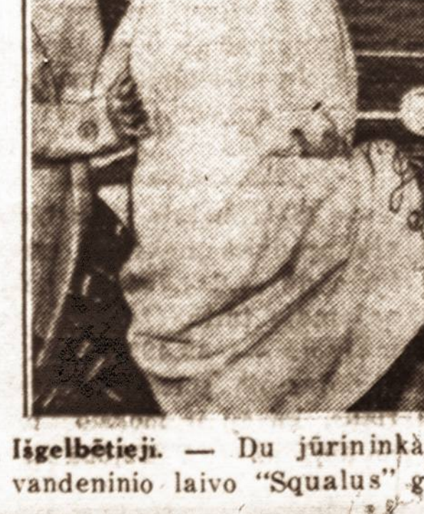
Igelbėtieji. — Du jūrininkai iškelti iš nuskenusio povandeninio laivo "Squalus" gabenami į krantą.

Pagaliam jis net j svetim-... (text continues)