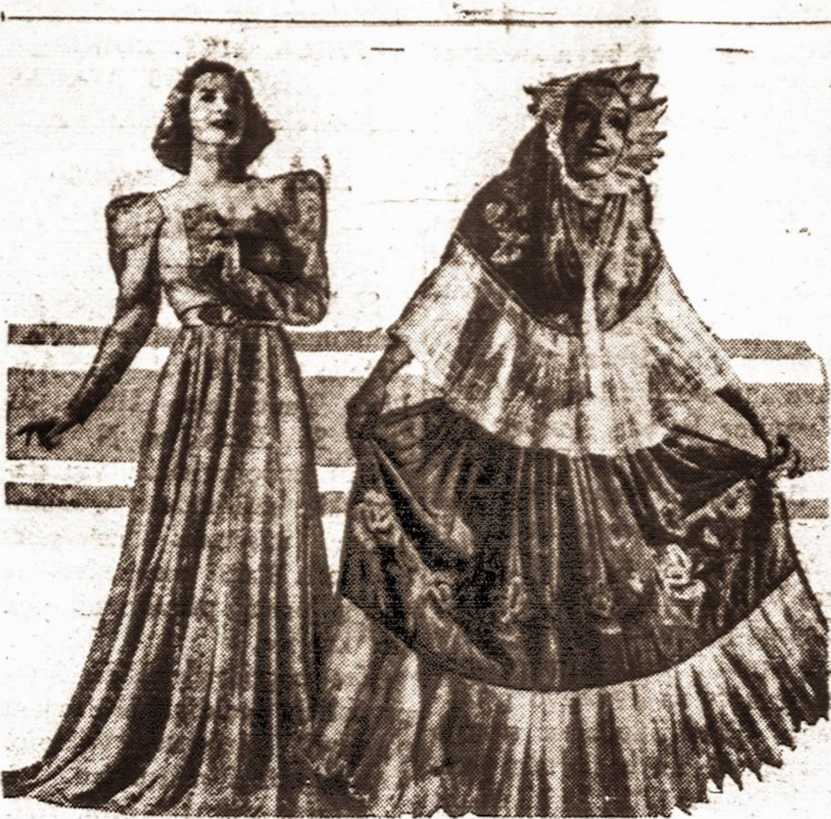
Kairėje, Ethyl Haworth demonstruoja balinę suknią, o dešinėje, filmų artistė Lupe Valez demonstruoja Meksikos moterų tautinį kostiumą. Jos kostiumas kainavo $30,000 ir užtruko 30 metų pagaminti.