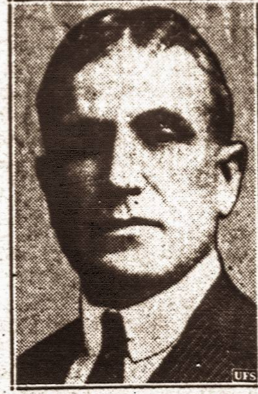
Įsileido. — Kubos Prezidentas Federico Laredo Bru, kuris sutiko išleisti 907 Vokietijos žydus tremtinius. Bet vėliau Kubos vyriausybė jo sutikimą atšaukė.