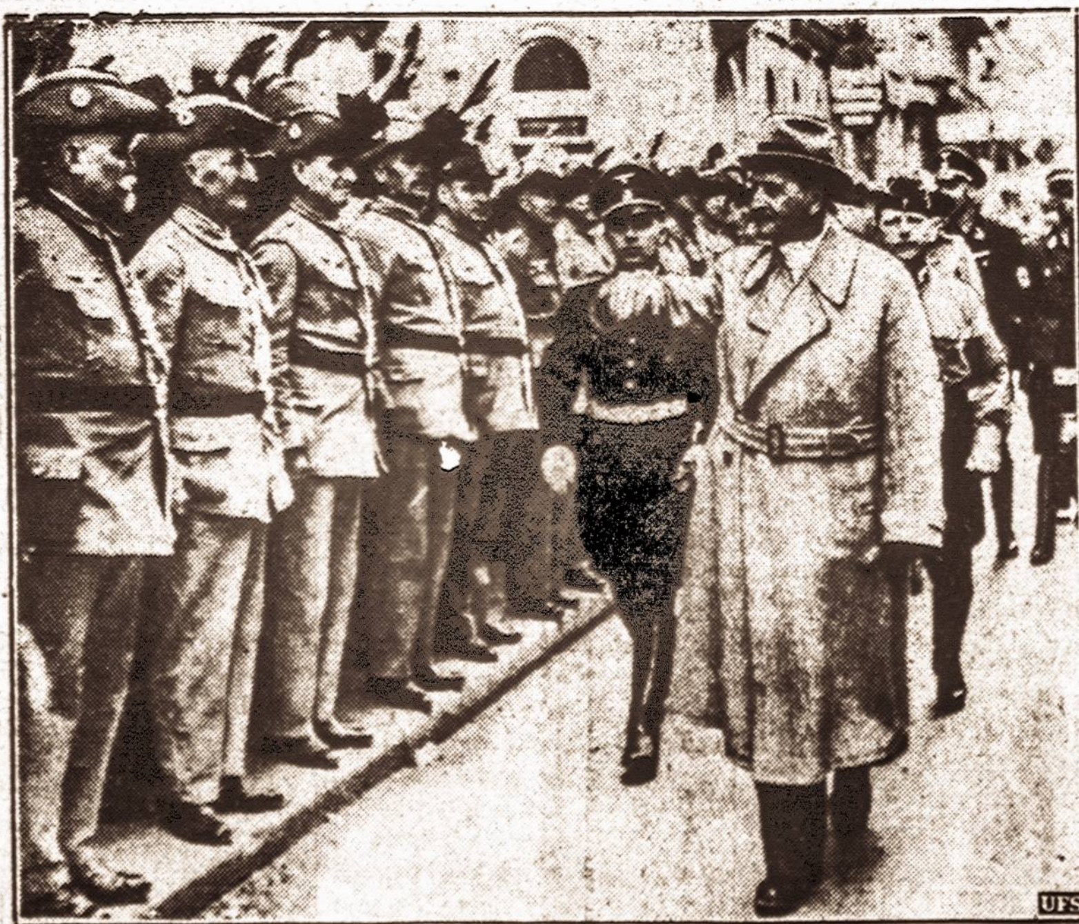
Vokiečių kolonijalė armija. — Nors Vokietija dar neturi kolonijų Afrikoje ar kitur, ji vis tik laiko savo senąją kolonijalę kariuomenę ir jos veteranus. Čia matyt Vokietijos kolonijalės kariuomenės veteranų paradas, kurio žiūri Gen. Ritter von Epp.

NUMATOMA: Apsinauks Lietuvos krituliai ir perkūnija. Saulė teka 5:23, leidžiasi 8:25. Dienos ilgis 15 val. 03 min.