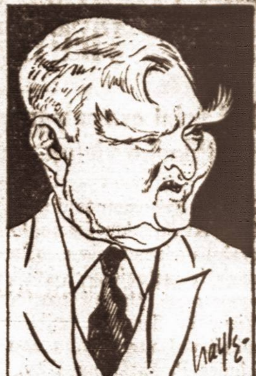
Caricature shows Vice President John Nance Garner, presidential candidate in 1940.

Who knows what she said, his once beloved, who, seated