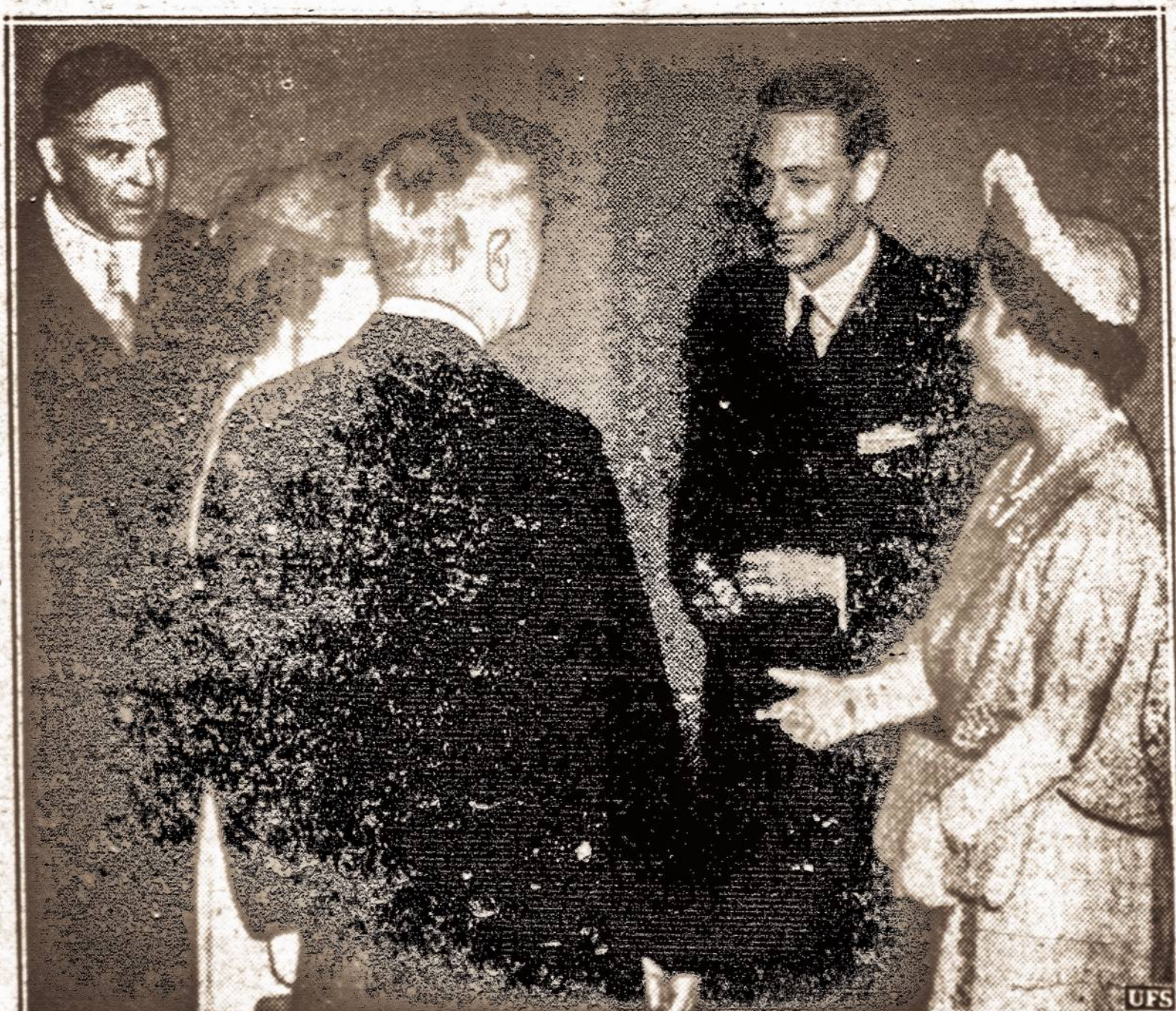
Karalius Amerikoje. — Anglijos karaliui ir karalienei pervažiavus į Ameriką juos ties Niagara Falls, N. Y. pasitiko Valstybės Sekretorius Cordell Hull su žmona.

NUMATOMA: Giedra. Pavakare gali būti lietus krituliai. Naktį vėsiau. Saulė teka 5:24, leidžiasi 8:25. Dienos ilgis 15 val. 04 min.