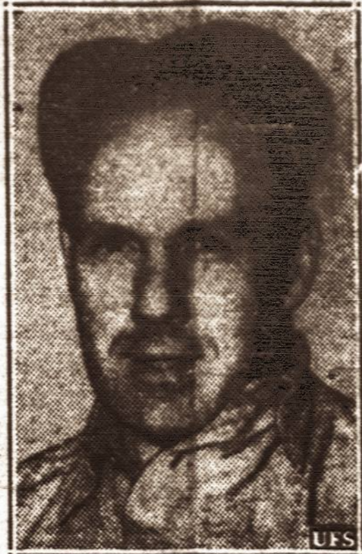
Detroito areštuotasis Airių sukilelių vadas Sean Russell. Britų Scotland Yard įtarė, būk jis galys kėsintis britų karaliui, dėl to ir suėmė.