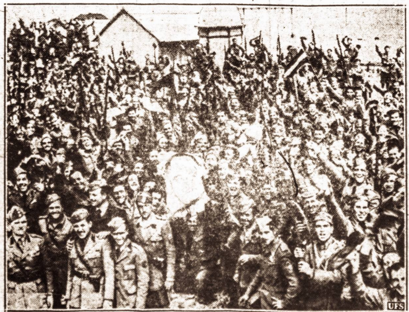
Didelės demonstracijos Ispanijoj. Jose pasmerkami ra dikalai, o nacionalistai triumfoja. Nešiojamas po g atves karą laimėjusio Franco paveikslas.

Kanada pasiūlė britų karalienei vieną iš tūkstančio gražiųjų salų dovanoti.