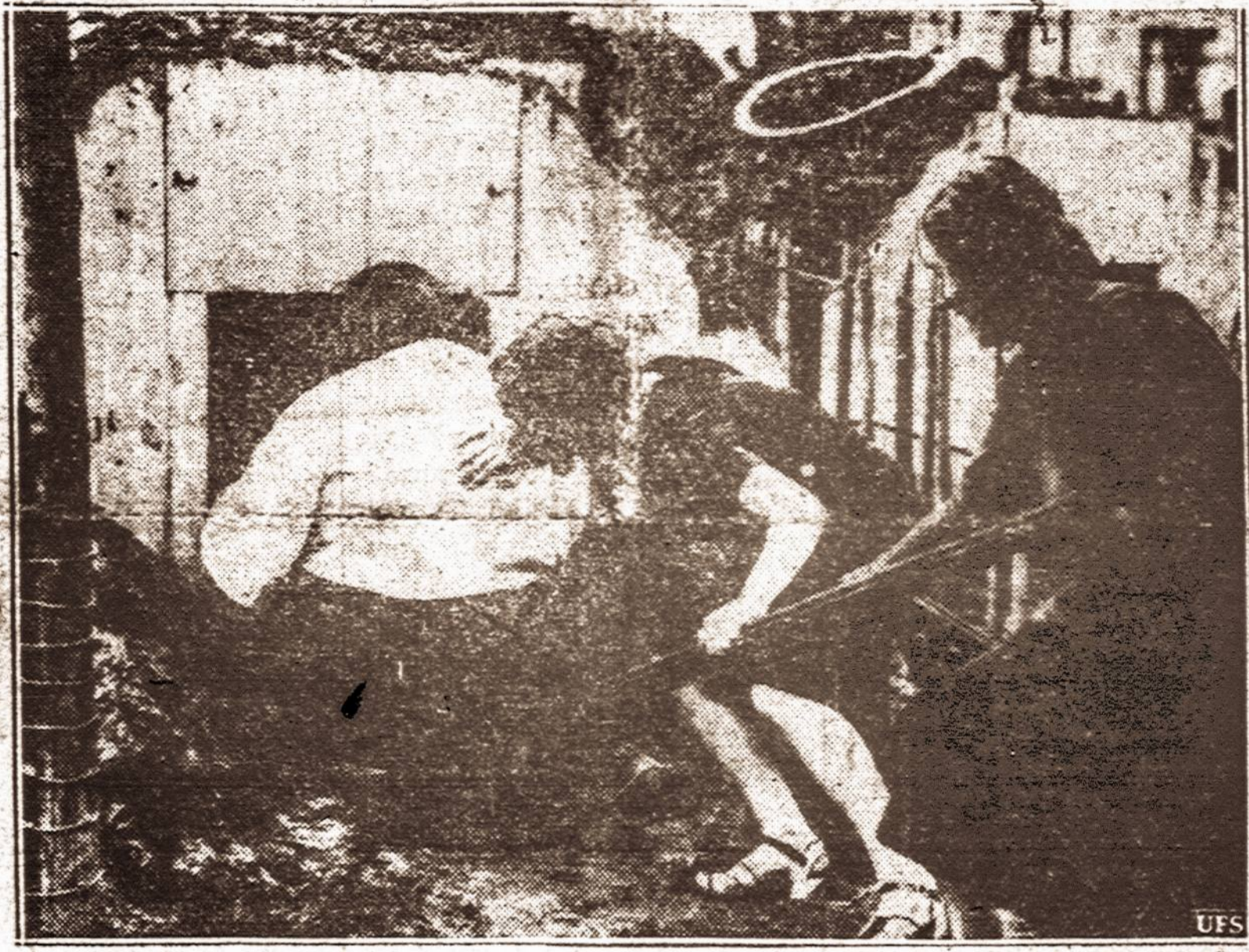
Jei kiltų karas, Londone žmonės taip slėpsis į pože minius urvus.

Puerto Rico buvo jaustas žemės drebėjimas.