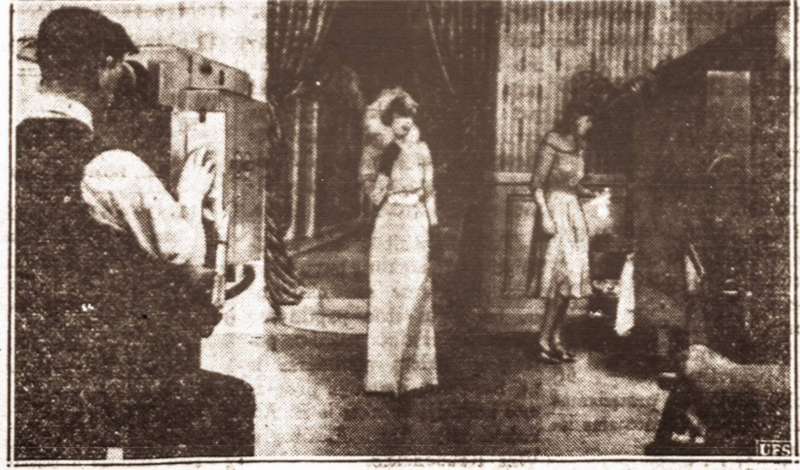
Televizijos studijoje. — Dabar smarkiai Amerikoje platinami nauji televizijos aparatai. Paveikslė matyt, kaip iš televizijos studijos perduodamas vaizdas. Po kelių metų televizijos aparatai bus taip populiarūs, kaip dabar paprastieji radijo imtuvai.