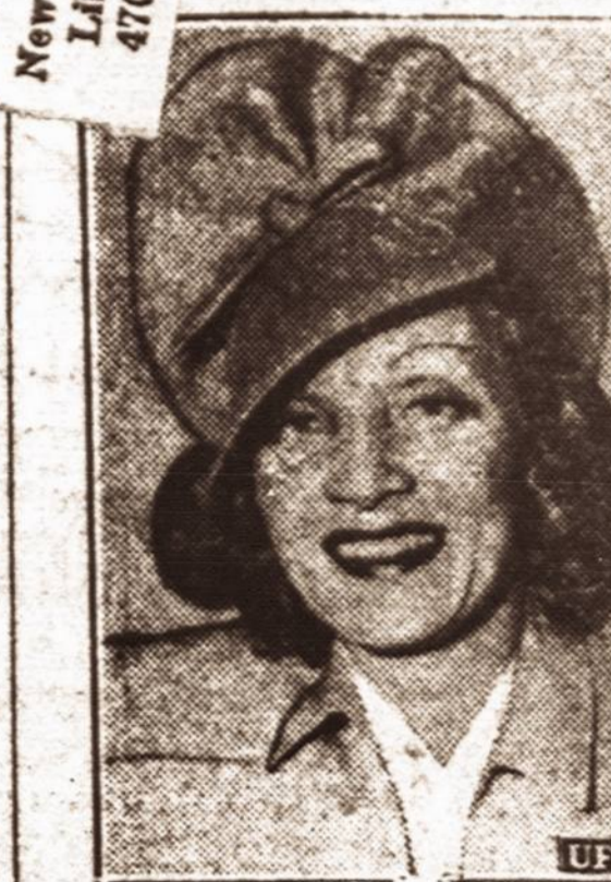
Ši gražnolė, filmų artistė Mariene Dietrich, Los Angeles priėmė Jungtinių Valstybių pilietybę. Iki šiol ji buvo Vokietijos, savo gimtinės pilietė. Jos skrybelaitė vadinama "militarine".

KAUNAS. — "Vyriausybės Žiniose" paskelbtas rajoninių elektros stočių akcinės bendrovės, kuri eksploatuoja Petrašiūnų elektros stotį, balansas, iš kurio matyti, kad perėtais metais bendrovė turėjo 1,382,117 lt. gryno pelno, iš kurio 138,000 lt. paskyrė į atsargos kapitalą, 840,000 lt. akcininkams išmokama dividendu skaitant po 7% metinių. Balansas siekia 18,058,000 lt. Kauno miestui apšviesti elektros bendrovės balansas dar nepaskelbtas.