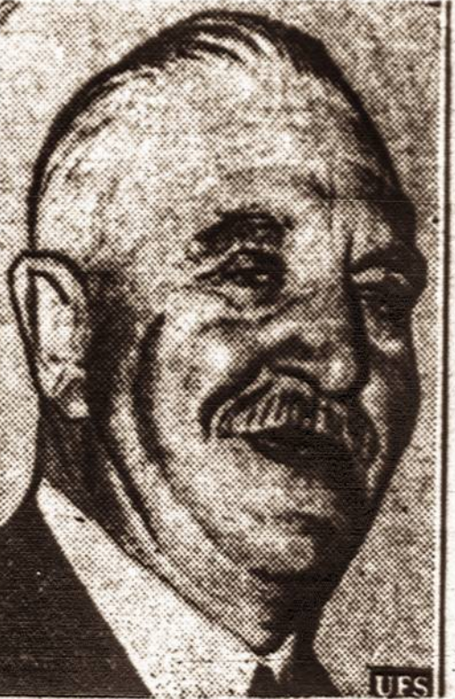
Atvyko. — Belgijos minis- tras, buvęs belgų Kongo Gubernatorius, Maurice Lip- pens, šiomis dienomis atvy- ko į New Yorką.

BERLIN. — Vokietijos-Lenkijos santykiai labiau įsitem- pia. Vieni kitų sugauna vis daugiau šnipų. Dabar šnipų pilni, tiek vienu, tiek kitų ka- lėjimai, ir jų visų vistikė ne- gali išnaikinti. Dėl to dabar nutarė sugautaisias šnipais pa- siekti. Kiek vokiečiai gražina lenkų, tiek lenkai gražina vokiečių.