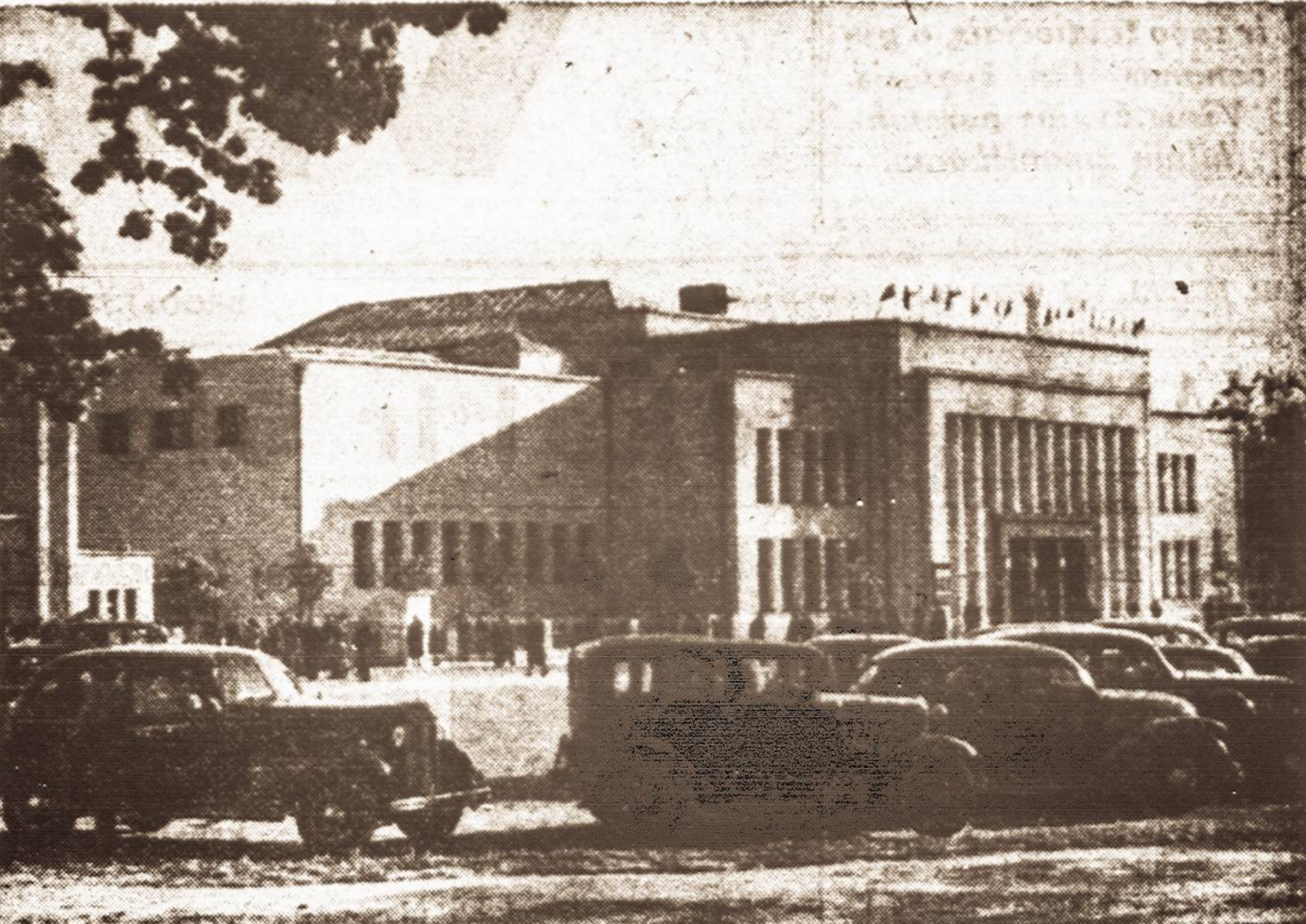
Lietuvos Kūno Kultūros Rūmai. Europos krepšinio (basketball) pirmenybių dienis, gegužės 21—28 d. Rūmų fasadas papuoštas visų pirmenybėse dalyvavusių valstybių: Lietuvos, Latvijos, Estijos, Suomijos, Lenkijos, Vengrijos, Italijos ir Prancūzijos vėliavomis.

— A. C. Hardys savo pasiūlymuose visai nesivaržo su gamybos išlaidomis, nes, jo nuomone, didelio laivo statyba ne vienos bendrovės, bet visos tautos reikalas.