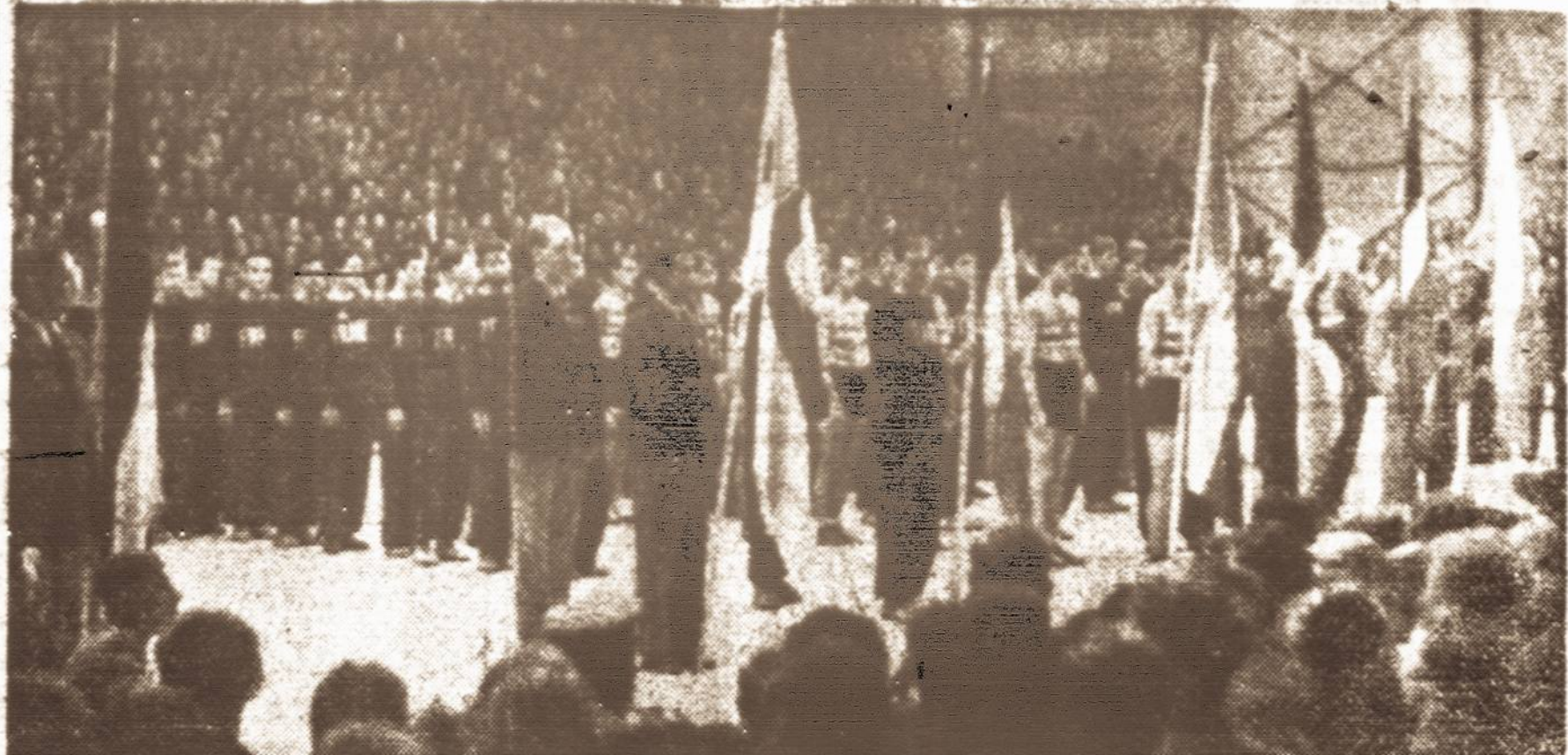
Trečiųjų Europos krepšinio pirmenybių uždarymas. Gegužės 28 d. Kaune baigėsi nuo gegužės 21 d. vykusios Lietuvos, Latvijos, Estijos, Suomijos, Lenkijos, Vengrijos, Italijos ir Prancūzijos rinktinių komandų rungtynės dėl Europos pirmenybių, kurias laimėjo Lietuva, nugalėjusi visus savo kompetitorius. Vaizde matome rungtynių uždarymo aktais, visų dalyvavusių valstybių komandoms su savo vėliavomis išsiriakius priėmimo vyriausybės tribūna.

Priešdujinių kaukių vien kariuomenei naujai gaminama 300,000 (šiuo metu U.S.A. kariuomenė turi jų 10,000). Labai daug Amerikoje gaminama ir civilinių priešdujinių kaukių.