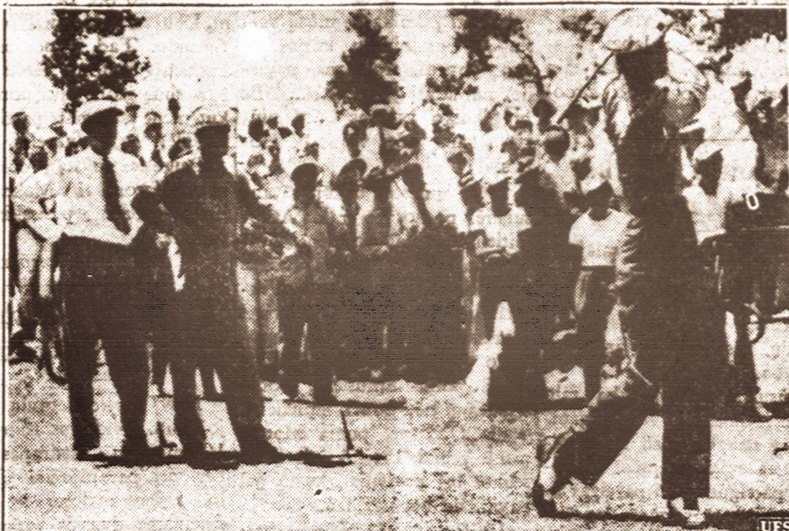
Starting the play-off. — Scene of the national open golf tournament at Philadelphia Country Club, as first play-off since 1913 begins. Byron Nelson, former Texas railway clerk, drives, as Denny Shute, left, P.G.A. champion, and Craig Wood, of New York, look on.