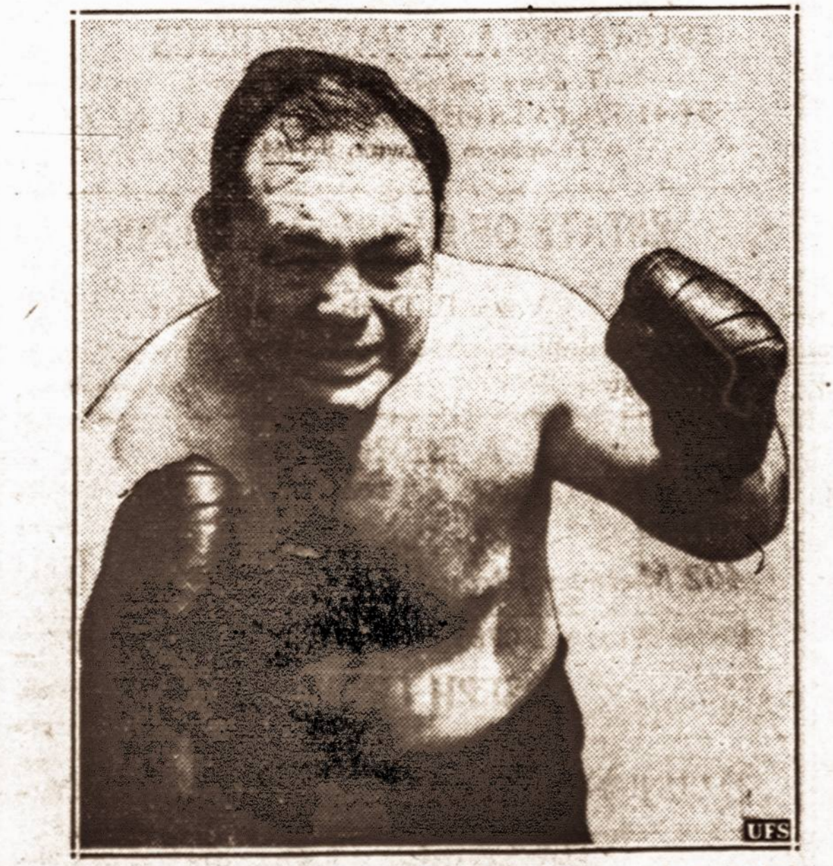
Ar Galento gali. — Tony Galento, sunkaus svorio boksininkas, kuris šio mėnesio 28 d. boksuošis su pasaulio čempionu Joe Louis, New Yorke.

Birželio 28, trečiadienį, vakare, Montrealo lietuvių parapijos choras duos koncertą Jūrininkų Institute (Seamans Institute) svetintaučiams ir lietuviams. Koncertą ruošia Katalikų Jūrininkų komitetas. Visi lietuviai prašomi ateiti pasiklausti. Institutas randasi kampe Commons ir St. Peter Streets.