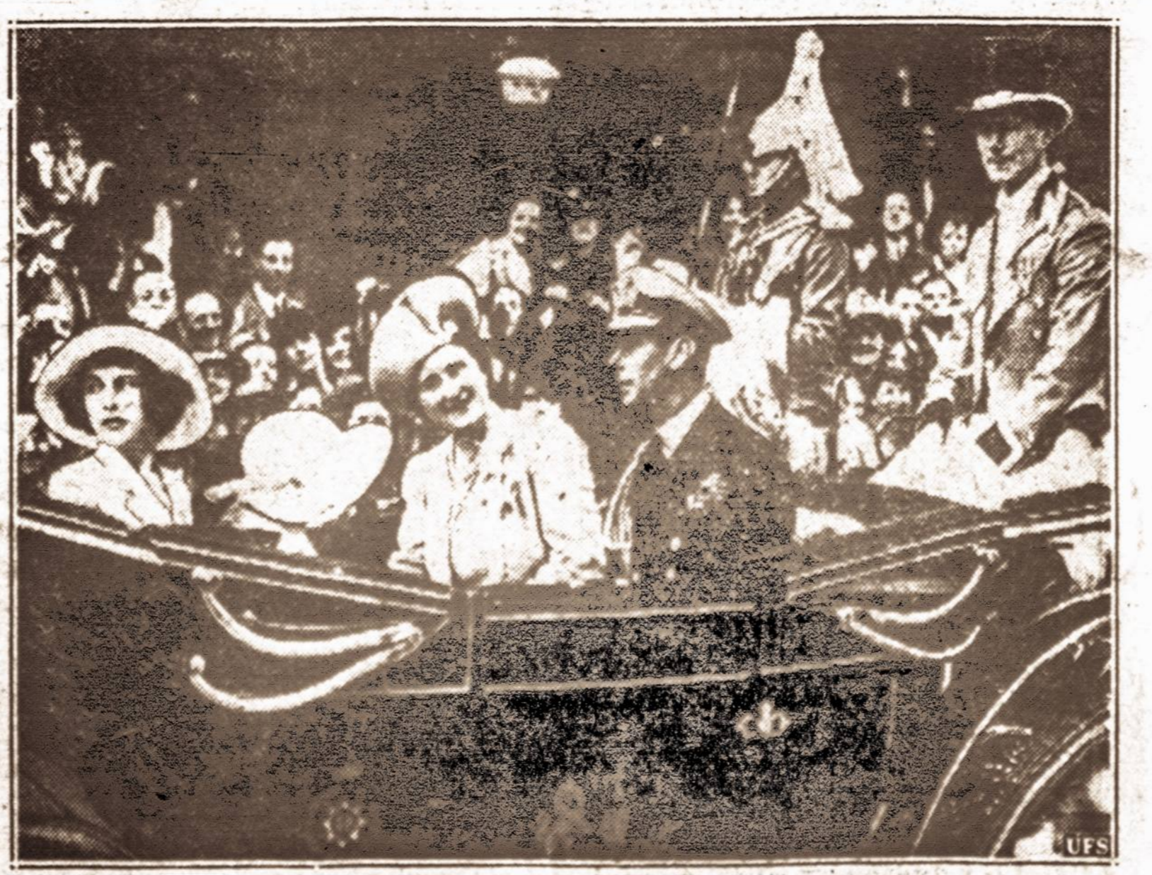
Namie. — Anglijos karalius ir karalienė šiomis dienomis grįžo į Angliją. Londono gyventojai juos stikto dideliu entuziazmu.

NUMATOMA: Dalimai apsiniauks. Mažas pasikeitimas temperatūroje. Saulė teka 5:25, leidžiasi 8:32. Dienos ilgis 15 val. 09 min.