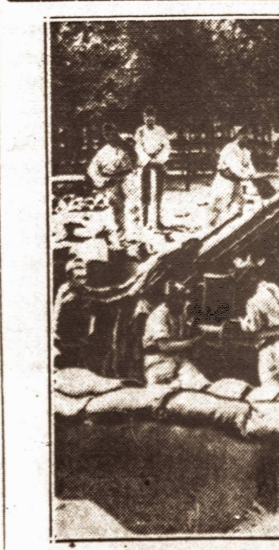
Paryžiaus apsaugai. — Netoli Napoleono kapo prancūzai Paryžiuje stato dideles priešlėktuvines armotas Paryžiaus apsaugai.

Visuomenė, susirinkusi į gausių seimų motinų pagerbimą, nutarė prašyti vyriausybės, kad visai būtų remiamos gausingos šeimos ir skatinamas tautos prieauglis, o kad tai lengviau būtų įgyvendinti, siūloma apdėti senbernius mokesčiais.