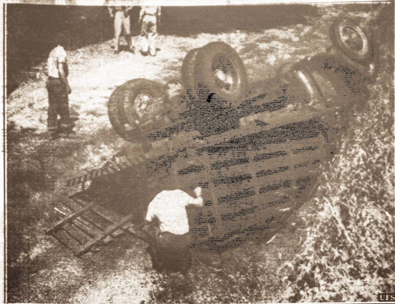
25 vaikučiai sužeisti. — Netoli Los Angeles, Cal. apsvirtė šis sunkvežimis, kuris vėžė keliasdešimtis vaikų. 25 vaikai buvo sunkiai sužeisti.