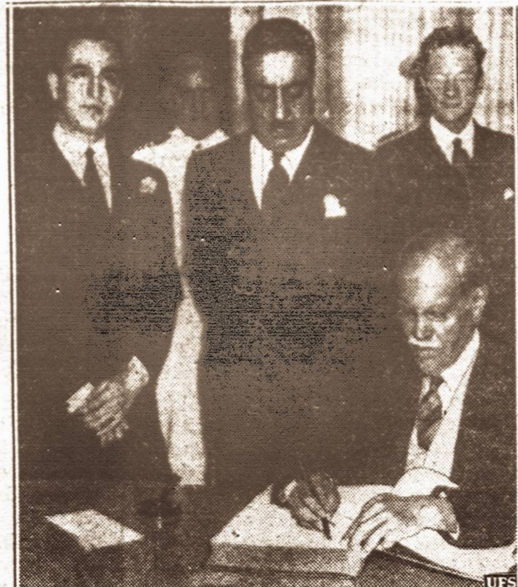
Indijos turtuolis. — Indijos turtuolis Macharadžas Kapurthala dabar lankosi Amerikoje. Jis pasirašo Pasaulinės Parodos svečių knygoje.

KAUNAS. — Pastaruoju metu atvyksta į Kauną užsieniečiai vis daugiau domisi lietuvių liaudies meno dirbiniais. Vien šį pavasarį "Marginių" parduotuvėje Vokietijos, Latvijos, Estijos ir Lenkijos piliečiai nupirko nemažą įvairių audinių, medžio dirbinių ir kt. Užsienio svečiai labiausiai perka drožtus iš medžio Lietuvos liaudies dirbinius.