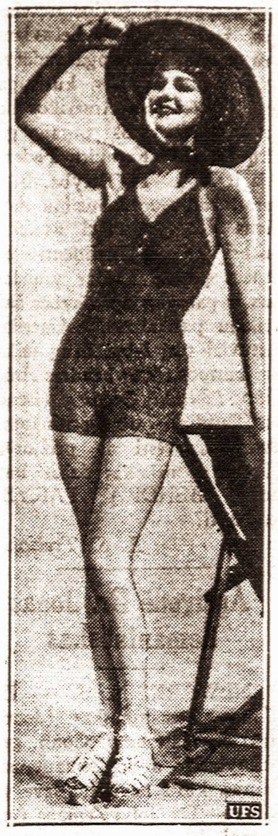
Naujas moterų maudymosi kostiumas padarytas iš vilnų ir gumos.