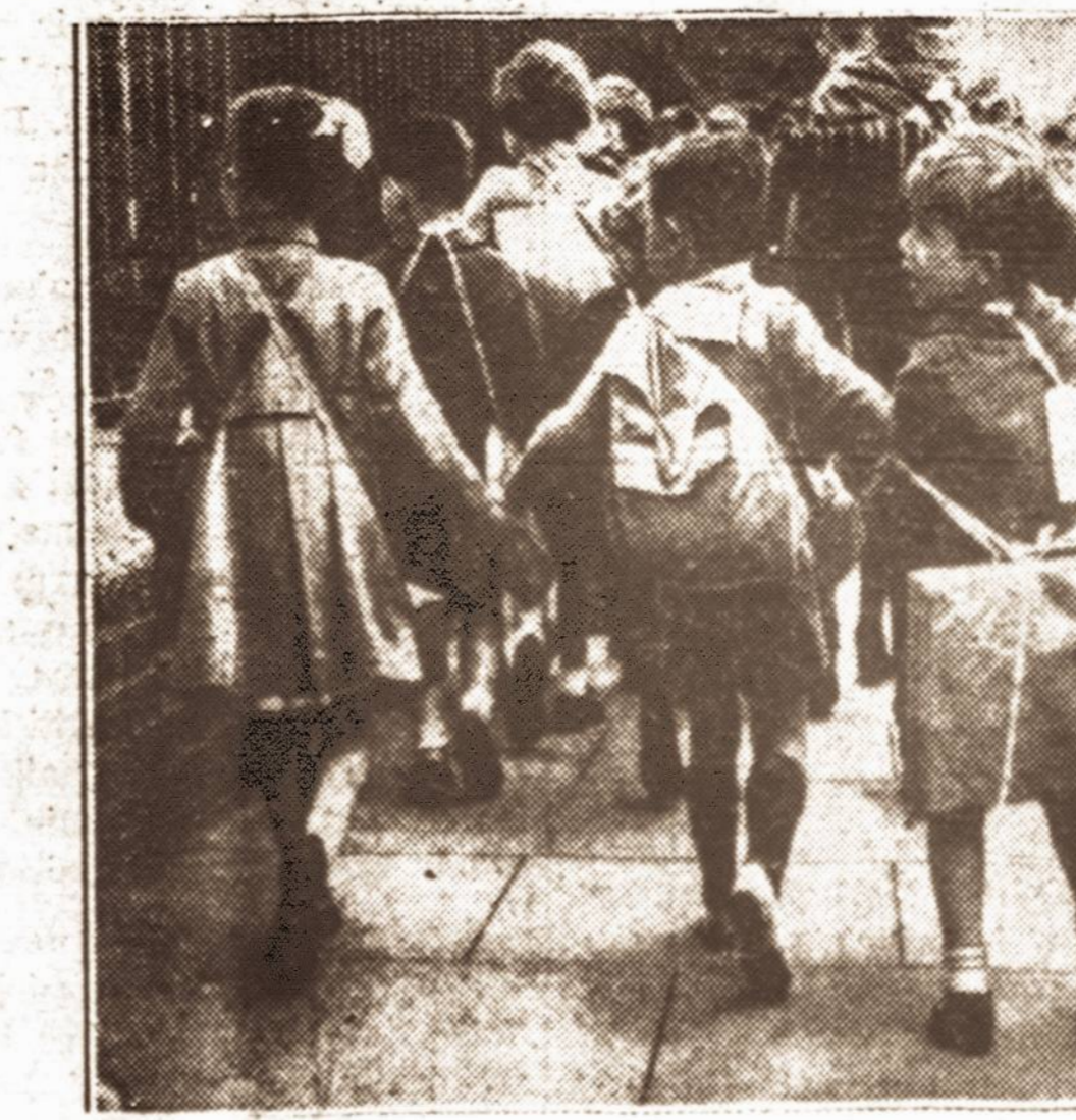
Vaikai pratinami karui. — Anglijos mokyklose kas savaitę bent vieną kartą kai pratinami karui. Čia matyti būrys vienos Londono mokyklos mokinių, kurie neva evakuojami iš Londono, priešui miestą pradėjus bombarduoti.

Per vieną gegužės mėn. Lietuvoje užregistruoti 2,036 nauji radijo abonentai, įsigiję radijo priimtuvus.