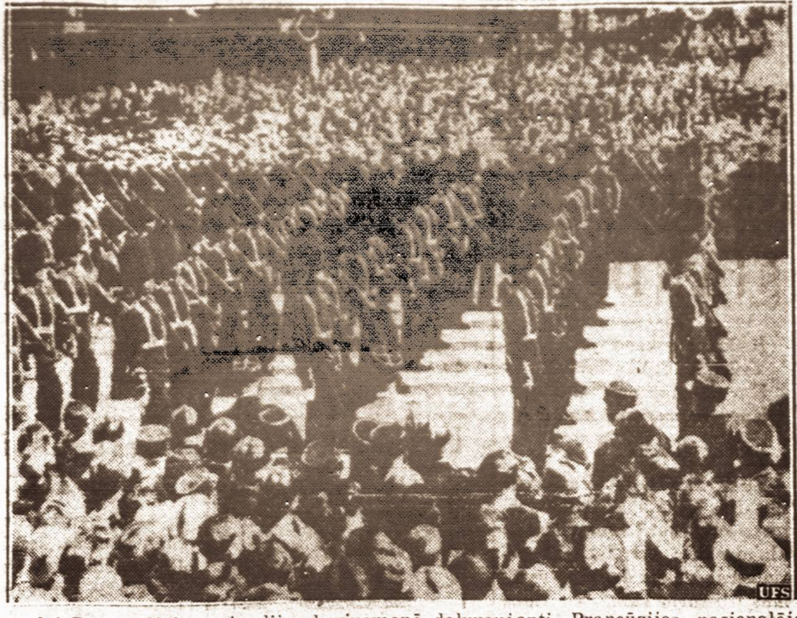
Anglai Prancūzijoje. — Anglijos kariuomenė dalyvaujanti Prancūzijos nacionalėje šventėje, maršuoja Paryžiaus gatvėmis. Anglai demonstruoja pasauliui Anglijos Prancūzijos vienybę.