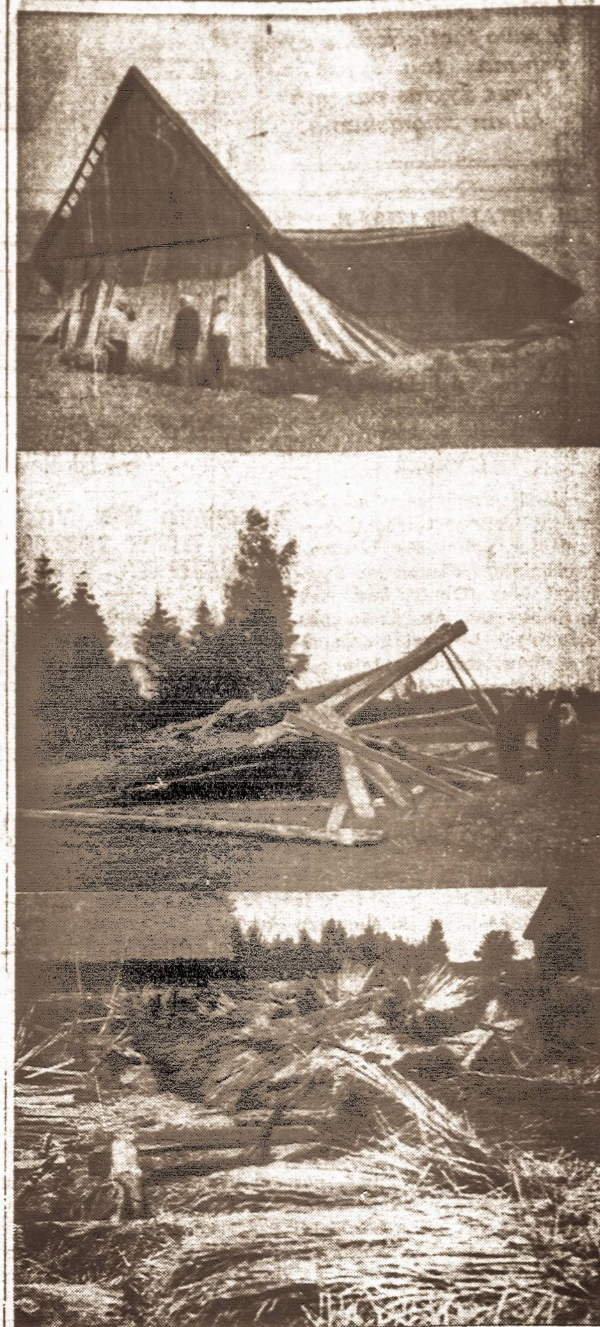
Šios vasaros audrų padariniai Lietuvoje. — Čia ne Kalifornijos ar Meksikos vaizdas po ciklono, bet daugelio Lietuvos kaimų reginiai po pakartotinių audrų, kokių čia nepamena net šimtamečiai seneliai.