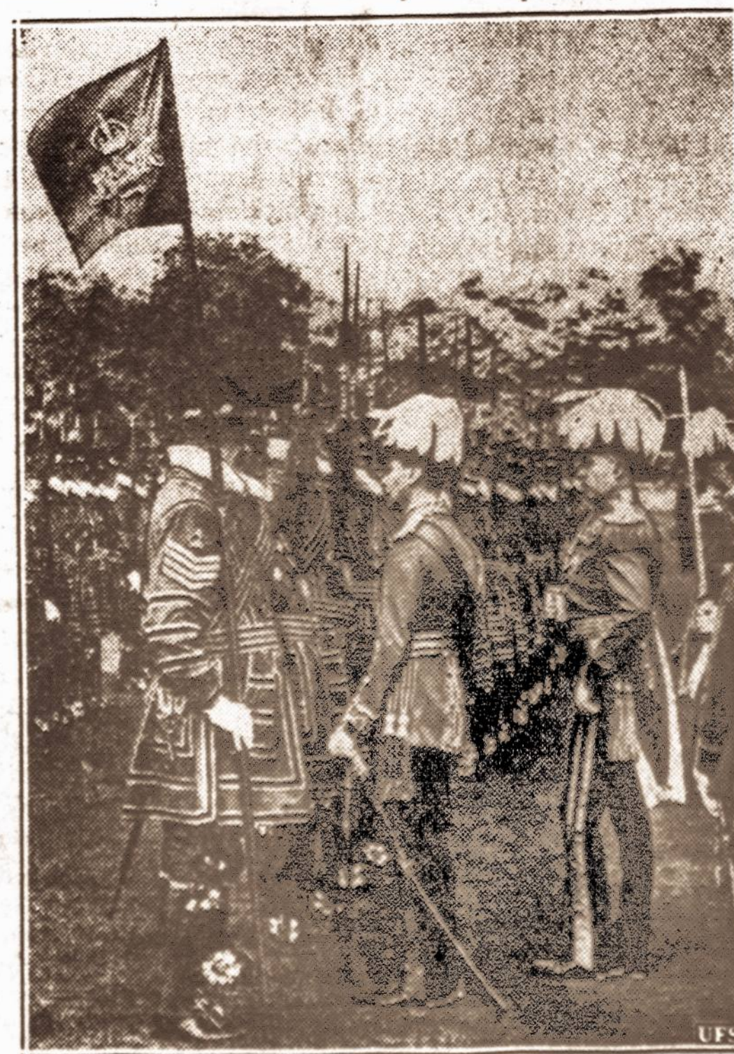
Apžiūri savo sargybą. — Anglijos Karalius Jurgis VI apžiūri savo rūmų sargybą. Šie sargybiniai dar nuo Tudorų laikų dėvėjo tokią uniformą.