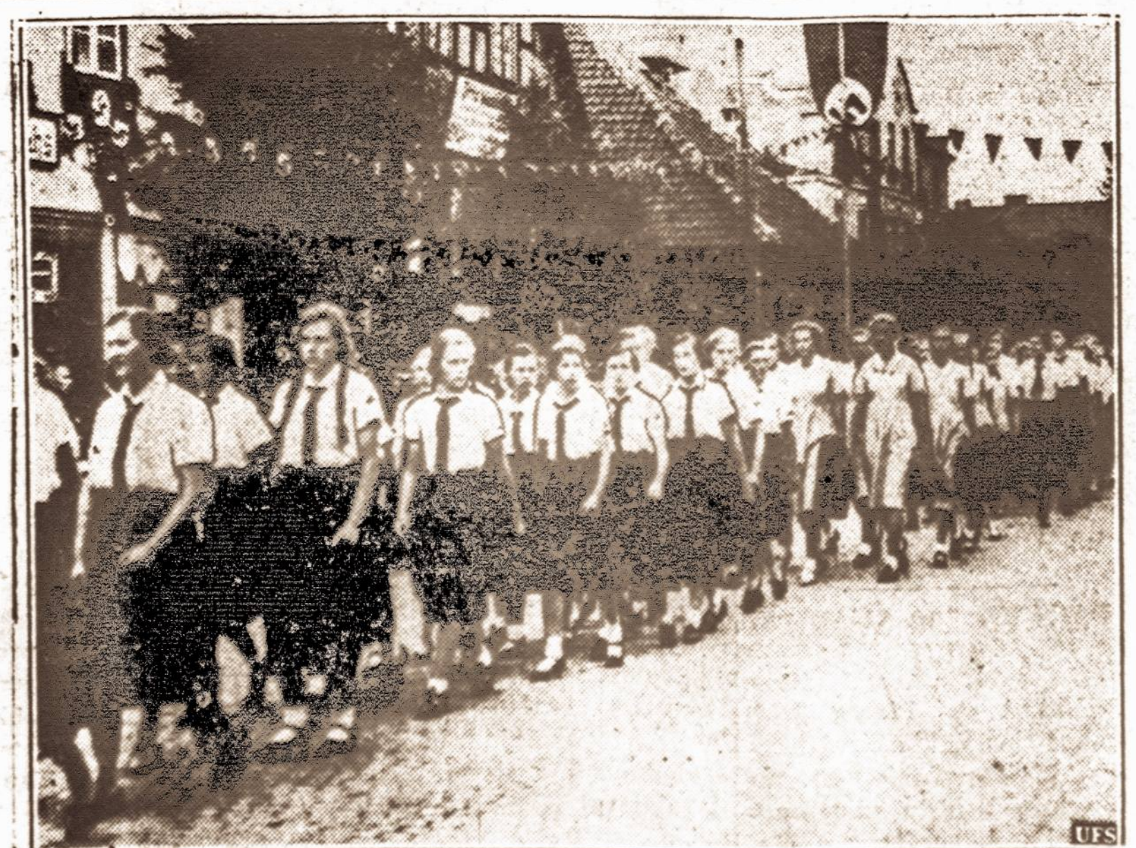
Danzigo vokiečių marioja. — Danzige ne tik vyrai bet ir moterys mokinamos būti naudingomis karo metu. Šios vokiečių, karo metu neįsuktų pranešimus ir reikalavimus pajaikytų ryšius tarp kariuomenės ir staibų.

NUMATOMA: Giedra. Mažas pasikeitimas temperatūroj. Saulė teka 5:42, leidžiasi 8:22. Dienos ilgis 14 val. 42 min.